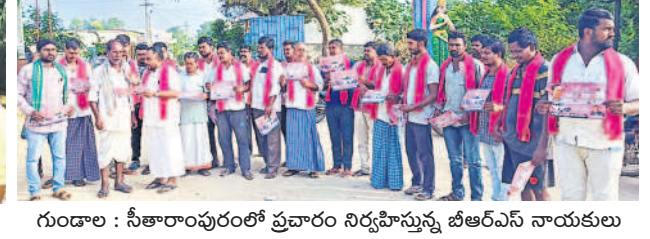
గుండాం : సీతారాంపురంలో ప్రచారం నిర్వహిస్తున్న బీఆర్ఎస్ నాయకులు