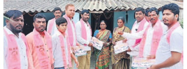
తుర్కపల్లి : వానాలమర్రిలో ఓటు అభ్యర్థిస్తున్న బీఆర్ఎస్ నాయకులు