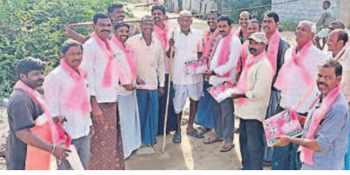
మోతూరు : కొండగడపలో ఇంటింటి ప్రచారం చేస్తున్న బీఆర్ఎస్ నాయకులు