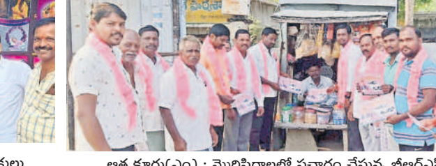
ఆత్మకూరు(ఎం) : మొరిపిరాలలో ప్రచారం చేస్తున్న బీఆర్ఎస్ నాయకులు