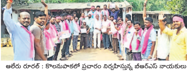
ఆలేరు రూర్ : కొలనుపాకలో ప్రచారం నిర్వహిస్తున్న బీఆర్ఎస్ నాయకులు