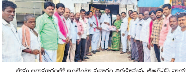
బొమ్మలరామారంలో ఇంటింటా ప్రచారం నిర్వహిస్తున్న బీఆర్ఎస్ నాయకులు