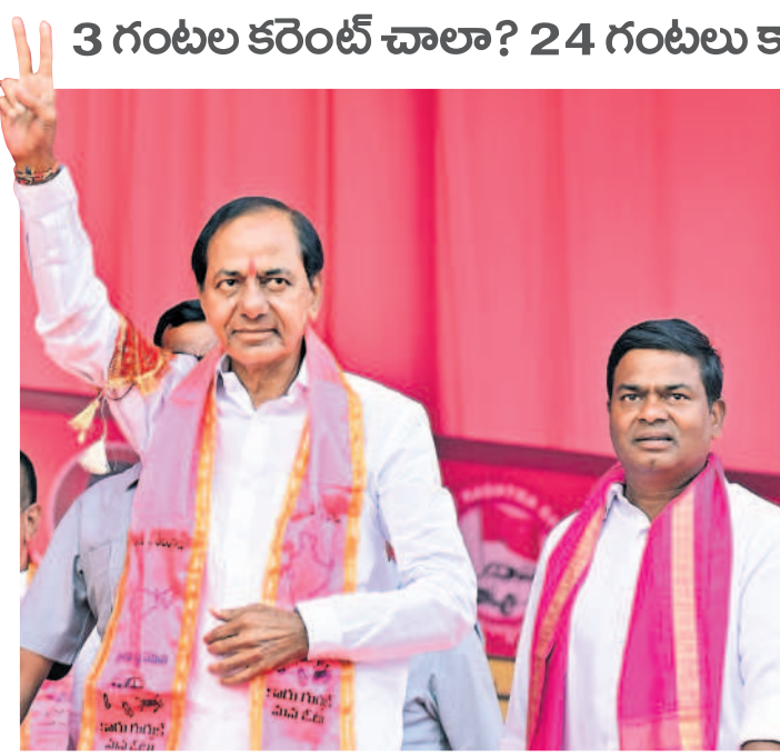
ఆర్కాట్ సభలో అభివాదం చేస్తున్న సీఎం కేసీఆర్. చిత్రంలో ఎమ్మెల్యే జీవన్ రెడ్డి