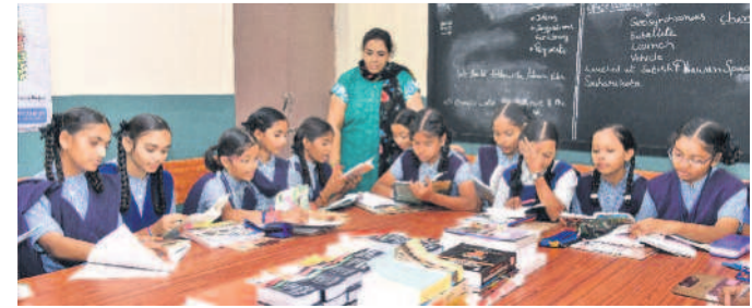
ఉపాధ్యాయుల సమక్షంలో ప్రభుత్వ పాఠశాల విద్యార్థుల పఠనం