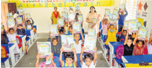
ప్రభుత్వం పంపిణీ చేసిన వర్క్ బుక్స్ తో బిన్నారలు