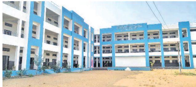
వర్షాకాలంలో 'మన ఊరు-మన బడి'లో పునర్నిర్మించిన ప్రభుత్వ ఉన్నత పాఠశాల