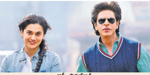
అనుష్కా షర్మ, రణ్ బీర్ కపూర్