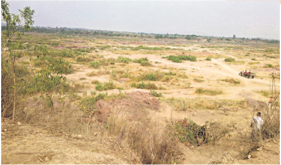
గోదావరి నదికి ఆ ఒడ్డున ఈ ఒడ్డున చాలా ఊళ్లుంటాయి. సాధారణంగా ఈ ఊళ్ల ప్రజల మధ్య మంచి సంబంధాలే ఉంటాయి...