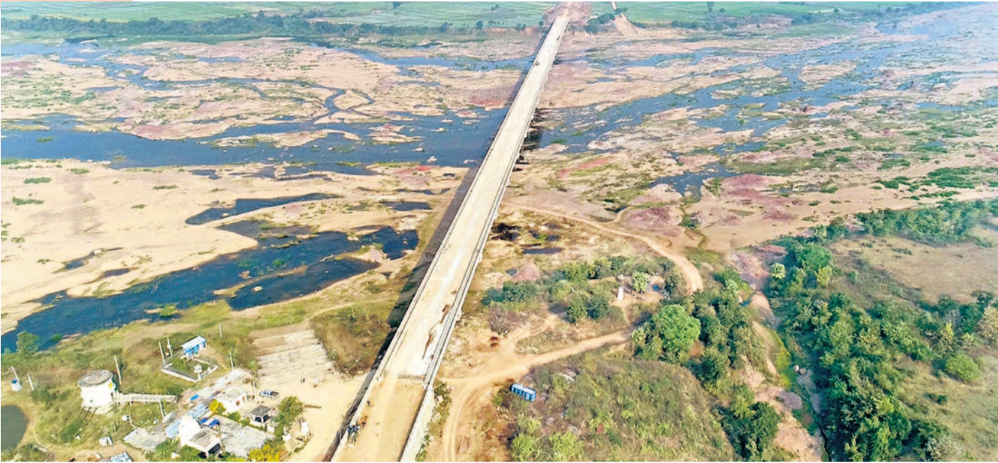
కేసీఆర్ ముఖ్యమంత్రి అయ్యాక కరీంనగర్ జిల్లా కేంద్రంలో జరిగిన సమావేశంలోనే బోర్లపెట్టి-విన్నబెల్లాల మధ్య గోదావరి నదిపై వంతెనను నిర్మించాలని సంతకించారు...