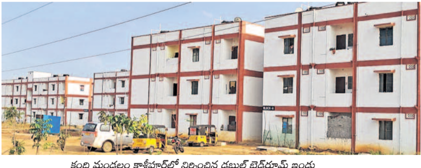
కంది మండలం కాశీపూర్లో నిర్మించిన డబుల్ బెడరూమ్ ఇండ్లు