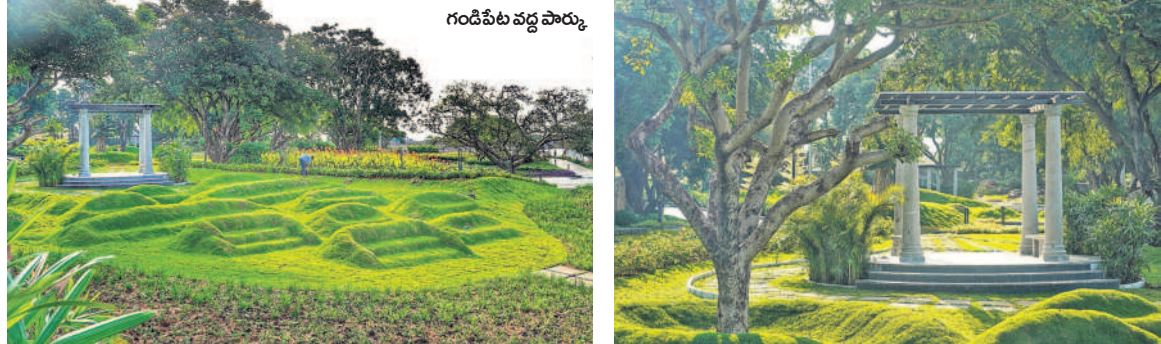
గుడిపేట వద్ద పచ్చదనం

ఆహారానికి నిలయంగా మారిన అర్బన్ ఫార్వెస్ట్ పార్కుల్లో పలు ప్రత్యేకతలు ఉన్నాయి. వివిధ ప్రాంతాల నుంచి నగరానికి చేరుకునే ప్రయాణికులు, నగరం నుంచి కుటుంబ సభ్యులతో ఈ పార్కుకు వెళ్లి సేద తీరాలా ఈ ఉద్యానవనాలను సిద్ధం చేశారు. అంతేకాకుండా ప్రతిరోజూ ఉదయం, సాయంత్రం వేళల్లో నడక కోసం వారింగ్ పాత్ వేలను, సైకిల్ కోసం సైకిల్ ట్రాక్‌లు, పిల్లలు ఆడుకునే విధంగా చిల్డ్రన్ కార్టర్లను ఏర్పాటు చేశారు. వీటితో పాటు యోగాసంబంధం, సందర్శకుల కుర్చునీం దుకు భారీ వృక్షాల కింద రచ్చబండలను సైతం ఏర్పాటు చేశారు. వాడ్ రూమ్‌లు, గజెట్ (గుడిసెలు)లు, సెక్యూరిటీ రూం, టెలిఫోన్ బాక్స్ వంటివి సైతం ఉన్నాయి.