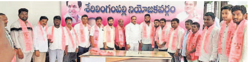
బీఆర్ఎస్ లో చేరిన భవన నిర్మాణ సంఘం నేతలు