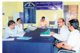
జనగామ ఆర్డీవో కార్యాలయంలో ఆర్కెస్, ఎస్సీకల అధికారులు