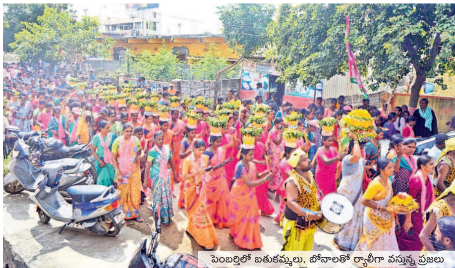
పెంబర్లిలో బతుకమ్మలు, బోనాలతో ర్యాలీగా వస్తున్న ప్రజలు