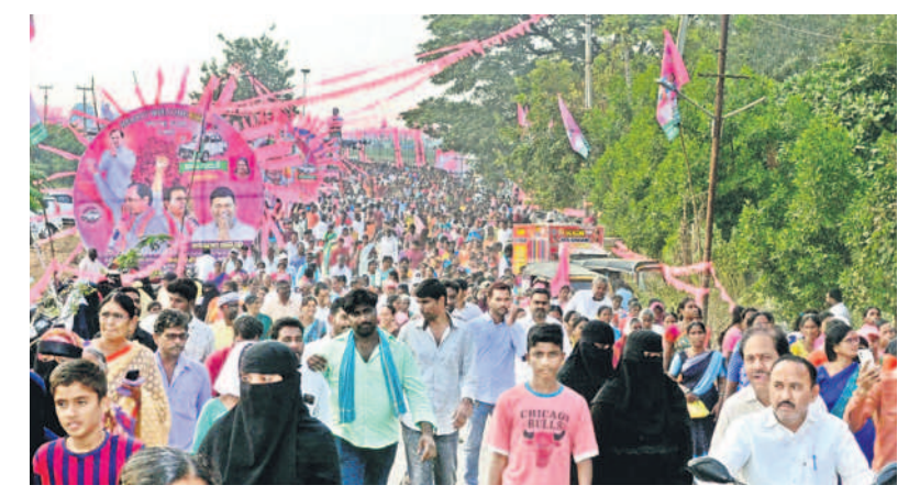
జనసంద్రం: ఆర్కూర్ ప్రజా ఆశీర్వాద సభకు తరలివస్తున్న అశేష జనవాహిని