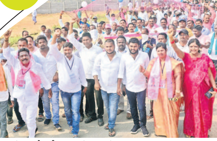
సభకు భారీ ర్యాలీగా తరలివస్తున్న గంగపుత్రులు