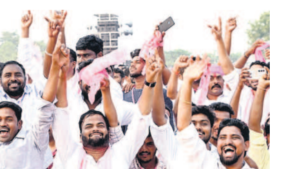
సభలో ఉత్సాహంగా స్పృశ్యం చేస్తున్న ప్రజలు