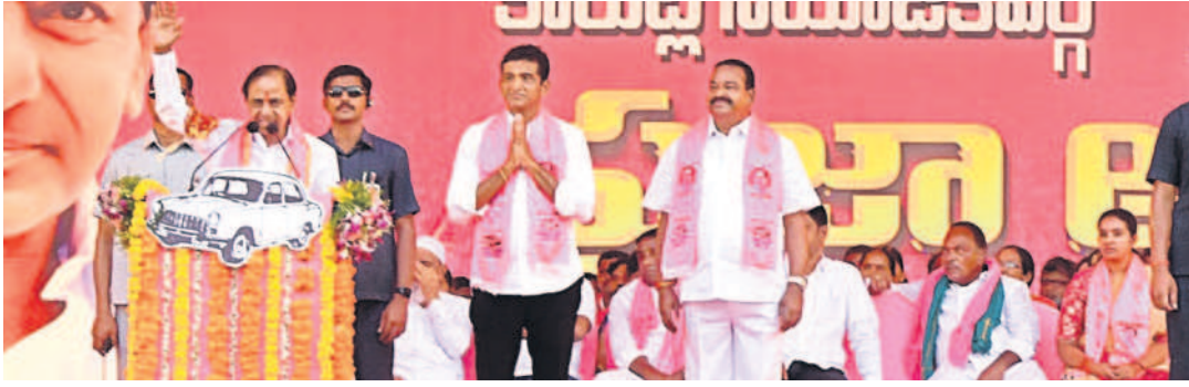
సీఎంకేసీఆర్ నమ్మకాన్ని నిలబెడతా

కోరుట్ల గడ్డమీద సీఎం కేసీఆర్ నాపై ఉంచిన నమ్మకాన్ని వమ్ము చేయకుండా వంద శాతం నిలబెడుతా. తెలంగాణ రాష్ట్రం కోసం ఆమరణ నిరాహార దీక్ష చేసిన సమయంలో కేసీఆర్ ను ఒక వైద్యుడిగా ధర్మం నుంచి చూశా. 2009లో చావునోట్లో తలకాయపెట్టిన కేసీఆర్ సార్ పోరాట పటిమను చూసి ఆహ్లాద ఆయన కింద పనిచేయాలని అనుకున్నా. వరద కాలం తెలంగాణ రాజకీయం ఎదురొచ్చింది. రాష్ట్రం వచ్చాక జీవనదిలా మారింది. ఈ ఘనత ముఖ్యమంత్రికి. నేను ఇదే గడ్డపై పుట్టిన బిడ్డను. పరాయి ప్రాంతం నుంచి వచ్చిన వాడిని కాదు. 20 ఏండ్లుగా మీతో కలిసి ఉన్నా. నన్ను ఆశీర్వదించి గెలిపించండి. నియోజకవర్గాన్ని మరింతగా అభివృద్ధి చేస్తూ, అందుబాటులో ఉండి సేవలందిస్తూ, ఈ ప్రాంతంలో ఎంతోమందిని అభివృద్ధి చేసిన అభివృద్ధి ఏమీలేదు. బీడీ కార్యకర్తలకు పింఛన్ ఇస్తున్న ఏకైక రాష్ట్రం తెలంగాణే. బీడీ కార్యకర్తలకు దయచేసి పింఛన్ పరిష్కారాలు ఎదురొచ్చున్న సమయంలో సీఎం కేసీఆర్ వారికి నెలకు ₹2,016 చొప్పున పింఛన్ ఇస్తూ ఒక పెద్దన్నలా సహాయ పడుతున్నారని. కోరుట్ల నియోజకవర్గంలో ఇంకా కొందరు పింఛన్ కోసం వేచిచూస్తున్నారు. వారికి కూడా పింఛన్ పంజారు చేయాలని కోరుతున్నా. మెట్టిపల్లి, కోరుట్ల పట్టణాల్లో డిగ్రీ పూర్తి చేసే యువతకు సౌకర్యంగా పీజీ కళాశాలలు ఏర్పాటు చేయాలని, వ్యవసాయ ఆధారిత ప్రాంతం కావడం వల్ల రైతుల కోసం ఒక ఉద్యాన వన కళాశాలను ఏర్పాటు చేయాలని నా విజ్ఞప్తి.