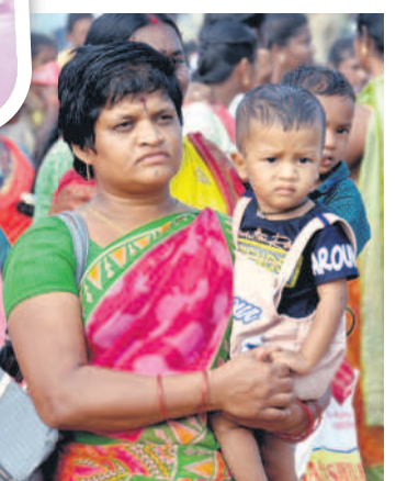
సభకు చిన్నారి తో వచ్చిన మహిళ