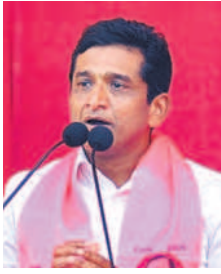
సీఎంకేసీఆర్ నమ్మకాన్ని నిలబెడతా

కోరుట్ల గడ్డమీద సీఎం కేసీఆర్ నాపై ఉంచిన నమ్మకాన్ని వమ్ము చేయకుండా వంద శాతం నిలబెడుతా. తెలంగాణ రాష్ట్రం కోసం ఆమరణ నిరాహార దీక్ష చేసిన సమయంలో కేసీఆర్ ను ఒక వైద్యుడిగా ధర్మం నుంచి చూశా. 2009లో చావునోట్లో తలకాయపెట్టిన కేసీఆర్ సార్ పోరాట పటిమను చూసి ఆహ్లాద ఆయన కింద పనిచేయాలని అనుకున్నా. వరద కాలం తెలంగాణ రాజకీయం ఎదురొచ్చింది. రాష్ట్రం వచ్చాక జీవనదిలా మారింది. ఈ ఘనత ముఖ్యమంత్రికి. నేను ఇదే గడ్డపై పుట్టిన బిడ్డను. పరాయి ప్రాంతం నుంచి వచ్చిన వాడిని కాదు. 20 ఏండ్లుగా మీతో కలిసి ఉన్నా. నన్ను ఆశీర్వదించి గెలిపించండి. నియోజకవర్గాన్ని మరింతగా అభివృద్ధి చేస్తూ, అందుబాటులో ఉండి సేవలందిస్తూ, ఈ ప్రాంతంలో ఎంతోమందిని అభివృద్ధి చేసిన అభివృద్ధి ఏమీలేదు. బీడీ కార్యకర్తలకు పింఛన్ ఇస్తున్న ఏకైక రాష్ట్రం తెలంగాణే. బీడీ కార్యకర్తలకు దయచేసి పింఛన్ పరిష్కారాలు ఎదురొచ్చున్న సమయంలో సీఎం కేసీఆర్ వారికి నెలకు ₹2,016 చొప్పున పింఛన్ ఇస్తూ ఒక పెద్దన్నలా సహాయ పడుతున్నారని. కోరుట్ల నియోజకవర్గంలో ఇంకా కొందరు పింఛన్ కోసం వేచిచూస్తున్నారు. వారికి కూడా పింఛన్ పంజారు చేయాలని కోరుతున్నా. మెట్టిపల్లి, కోరుట్ల పట్టణాల్లో డిగ్రీ పూర్తి చేసే యువతకు సౌకర్యంగా పీజీ కళాశాలలు ఏర్పాటు చేయాలని, వ్యవసాయ ఆధారిత ప్రాంతం కావడం వల్ల రైతుల కోసం ఒక ఉద్యాన వన కళాశాలను ఏర్పాటు చేయాలని నా విజ్ఞప్తి.