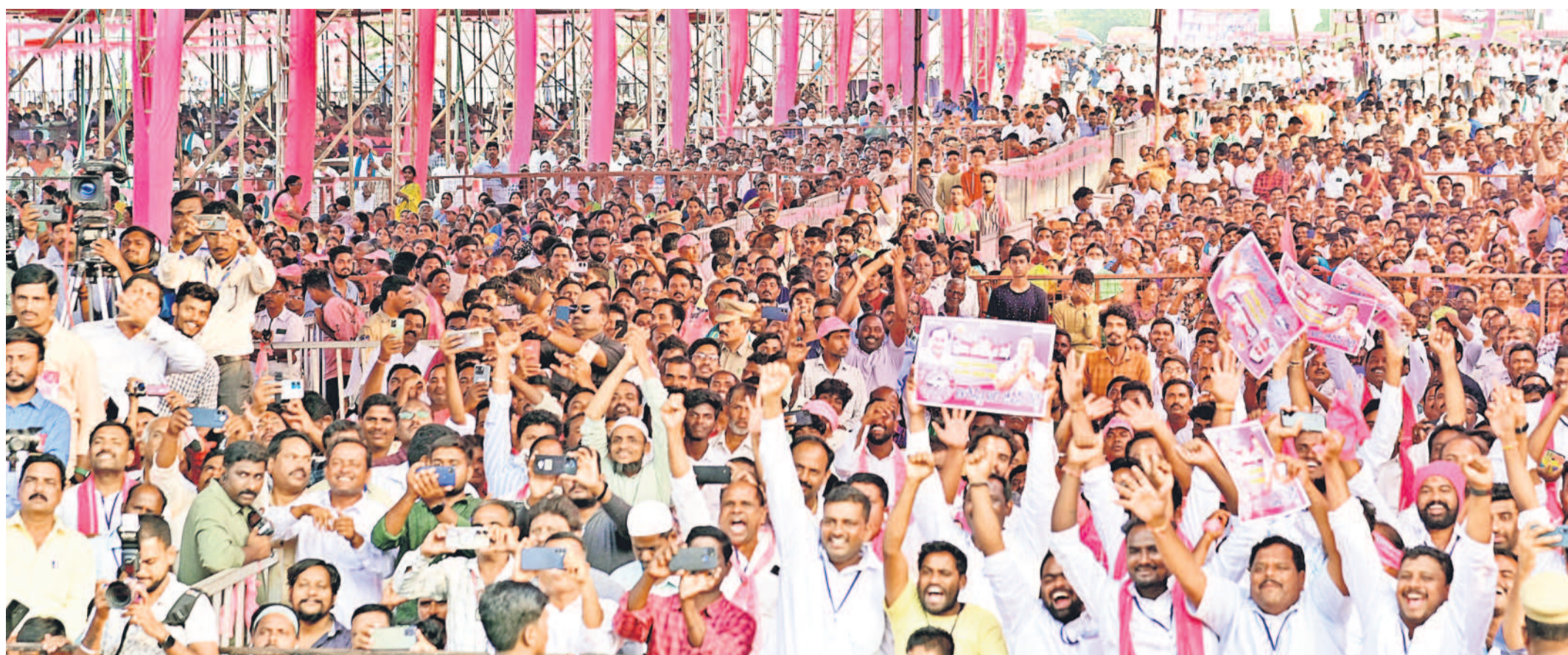
శుక్రవారం నిజామాబాద్ జిల్లా ఆర్కాట్ నిర్వహించిన బీఆర్ఎస్ ప్రజా ఆశీర్వాద సభకు ప్రజలు స్వచ్ఛందంగా తరలిరావడంతో నిండిపోయిన సభా ప్రాంగణం. ఫిక్సీలు చేతబూని 'జై తెలంగాణ.. జై బీఆర్ఎస్.. జై సీఎం కేసీఆర్' నినాదాలతో హాజరైస్తున్న ప్రజలు