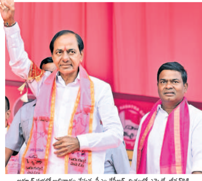
ఆర్కాట్ సభలో అభివాదం చేస్తున్న సీఎం కేసీఆర్. చిత్రంలో ఎమ్మెల్యే జీవన్ రెడ్డి

3 గంటల కరెంట్ చాలా? 24 గంటలు కావాలా? • ట్రాన్స్ ఫార్మర్ కాలితే మనిషికి 2 వేలు వసూలు చేసేటోళ్లు