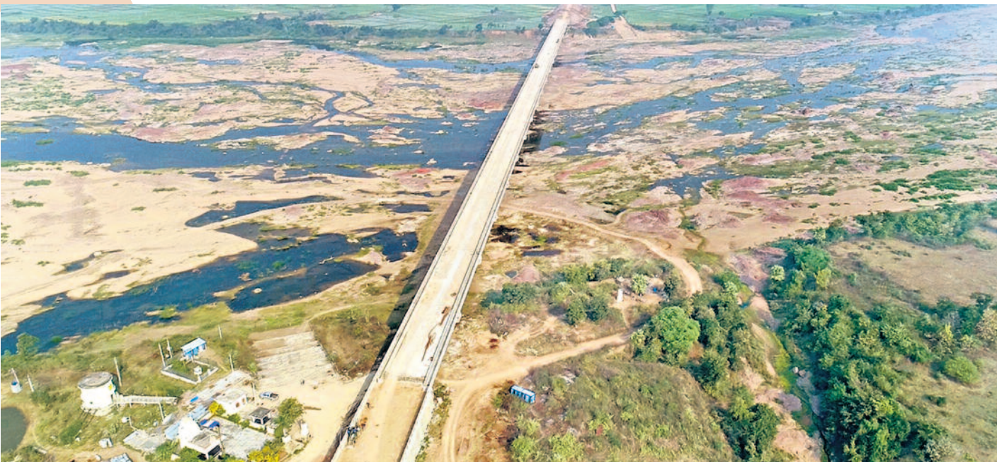
కేసీఆర్ ముఖ్యమంత్రి అయ్యాక కరీంనగర్ జిల్లా కేంద్రంలో జరిగిన సమావేశంలోనే బోర్లపెల్లి-చిన్నబెల్లాల మధ్య గోదావరి నదిపై వంతెనను నిర్మించాలని సంతకం చేశారు. దబుల్ రోడ్డు ట్రిప్లీ నిర్మాణానికి రూ.70 కోట్లు మంజూరు చేశారు. 2015 మార్చిలో ప్రారంభమైన వంతెన పనులు మూడేండ్లలో పూర్తయ్యాయి. కిలోమీటర్ పొడవుండే ఈ వంతెన జగిత్యాల, నిర్మల్ జిల్లాల మధ్య దూరాన్ని ఏకంగా 79 కిలోమీటర్ల తగ్గించింది. దీంతో రెండు జిల్లాలూ వంతెన సౌకర్యం ఒక్కటయ్యాయి. రెండు ప్రాంతాల ప్రజలు ఆనందాన్ని వ్యక్తం చేస్తున్నారు.