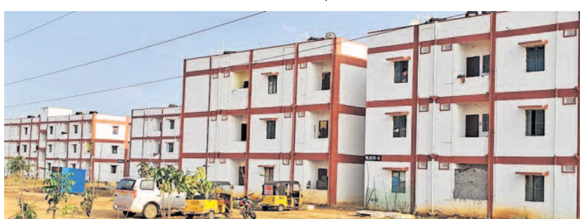
కంది మండలం కాశీపూర్లో నిర్మించిన డబుల్ బెడ్రూమ్ ఇండ్లు