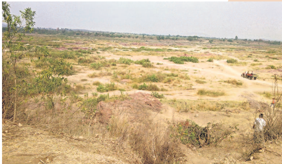
గోదావరి నదికి ఆ ఒడ్డున ఈ ఒడ్డున చాలా ఊళ్లుంటాయి. సాధారణంగా ఈ ఊళ్ల ప్రజల మధ్య మంచి సంబంధం ఉంటాయి. నిత్యం రాకపోకలు సాగిస్తుంటారు. జగిత్యాల జిల్లా రామకల్ మండలం బోర్లపెల్లి- నిర్మల్ జిల్లా చిన్నబెల్లాల గ్రామాల్లా అలాంటివే. నది ఎక్కువగా పారలవ్వడం గోదావరిలో నుంచే వీళ్ల ప్రయాణం సాఫీగా సాగింది. ప్రవాహం ఎక్కువయితే రాకపోకలు సాధ్యమయ్యేవి కావు. పక్క ఊరికి వెళ్లాలంటే, 79 కిలోమీటర్ల ప్రయాణం వచ్చేది. తమ ఊళ్ల మధ్య వంతెన కట్టమని ప్రజలు దశాబ్దాలుగా పోరాటం చేసినా ఫలితం శూన్యమే అయ్యింది.