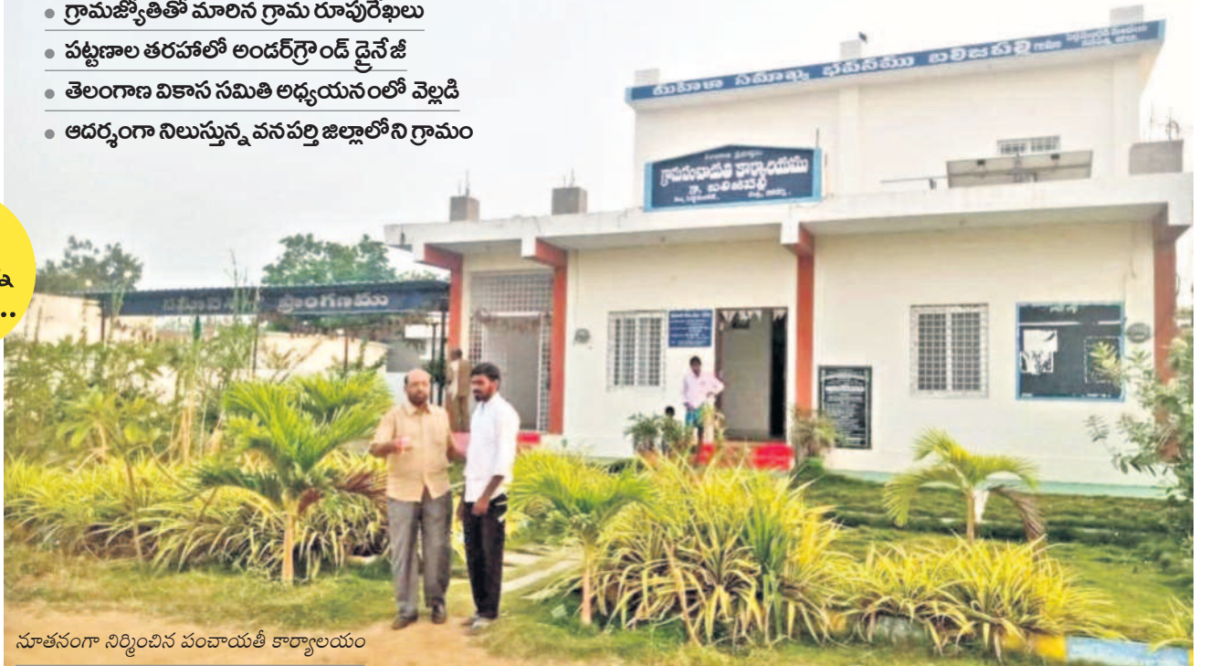
సూతనంగా నిర్మించిన పంచాయతీ కార్యాలయం

తెలంగాణ సర్కారు ఏం చేసినా తప్పబట్టి ప్రతిపక్షాలకు సమాధానం.. బలిజపల్లి. తెలంగాణ ఆదర్శ పల్లెలకు నిదర్శనం బలిజపల్లి. ప్రగతికి కేరాఫ్ బలిజపల్లి.