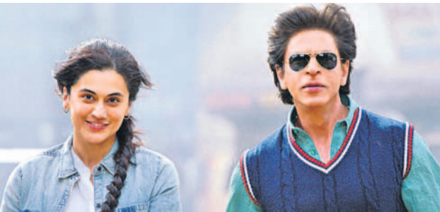
అనుష్కా, వరుణ్ ధవాన్