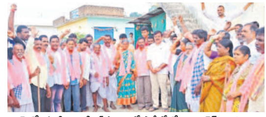
ఎమ్మెల్యే చంటి క్రాంతి కిరణ్ సమక్షంలో పార్టీలో చేరిన కాంగ్రెస్ నాయకులు