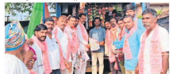
ఎక్స్ ప్యూర్ లో ఇంటింటి ప్రచారంలో పాల్గొన్న బీఆర్ఎస్ మండల నాయకులు