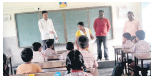
కాసిపేట : దేవాపూర్లో పరీక్ష నిర్వహిస్తున్న ఉపాధ్యాయులు

కాసిపేట, నవంబర్ 3 : కాసిపేట మండలంలోని ఆయా పాఠశాలల్లో గురువారం సీస్ స్టేట్ ఎడ్యుకేషన్ అచీవ్మెంట్ సర్వే పరీక్ష ను నిర్వహించారు. 3,6,9 తరగతుల విద్యార్థులకు అభ్యాసన సామర్థ్యాలుపై పరీక్ష నిర్వహించారు. 24 గంటల పర్యవేక్షణలో చెక్ పోస్ట్ ను నిర్వహిస్తున్నట్లు తెలిపారు. సిబ్బందికి పలు సూచనలు చేశారు. డీసీపీ వెంట మందమర్రి సీబి మహేందర్ రెడ్డి, కాసిపేట ఎస్ఐ గంగారం ఉన్నారు.