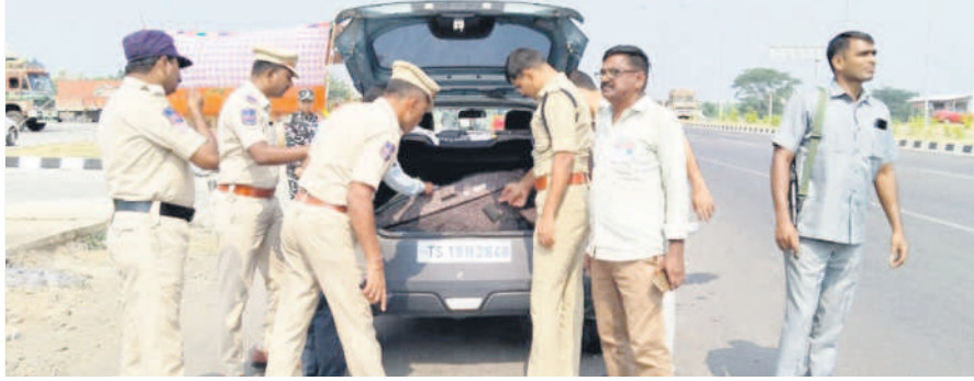
కాసిపేట : వాహనాల తనిఖీని పరిశీలిస్తున్న డీసీపీ సుధీర్ రాంనాథ్ కేకన్

కాసిపేట, నవంబర్ 3 : తనిఖీల సమయంలో సిబ్బంది అప్రమత్తంగా వ్యవహరించడంతో పాటు వాహనాలను ఖచ్చితంగా పరిశీలించాలని మంచినీటి డీసీపీ సుధీర్ కేకన్ ఆదేశించారు. గురువారం కాసిపేట పోలీస్ స్టేషన్ పరిధిలోని సోమగూడెం జాతీయ రహదారిపై గల బోల్ షాజా వద్ద చెక్ పోస్ట్ ను ఆకస్మికంగా తనిఖీ చేశారు. వాహన తనిఖీలు చేసిన వాహనాలను నమోదు చేసిన రిజిస్ట్రేషన్ పరిశీలించడంతో పాటు స్వయంగా వాహనాలను తనిఖీ చేశారు. ఈ సందర్భంగా డీసీపీ సుధీర్ రాంనాథ్ కేకన్ మాట్లాడుతూ ఎన్నికలను సజావుగా నిర్వహించేందుకు చెక్ పోస్టులు కీలకమని తెలిపారు. మంచినీటి జోన్ చెక్ పోస్టులో సాయుధ బలగాలతో కూడిన వ్యవహారాలతో పకడ్బందీగా నిత్యం చెక్ పోస్ట్ లు నిర్వహిస్తున్నట్లు తెలిపారు. అక్రమ మార్గంలో ఎటువంటి మద్యం, డబ్బు, ప్రజలను ప్రలోభ పెట్టే వస్తువులను రాకుండా వివిధ శాఖల సమన్వయంతో