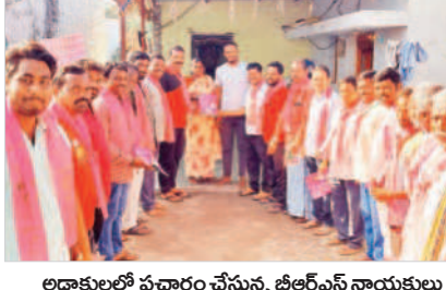
అడ్డాకులలో ప్రచారం చేస్తున్న బీఆర్ఎస్ నాయకులు