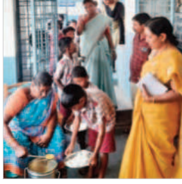
భోజనాన్ని పరిశీలిస్తున్న దృశ్యం