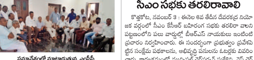
సమావేశంలో మాట్లాడుతున్న ఎంపీపీ