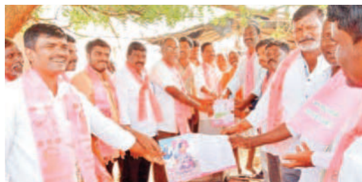
పేట మండలం చిన్నజుట్లంలో..