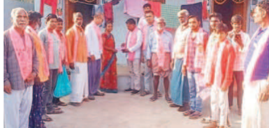
నారాయణపేటలో ప్రచారం చేస్తున్న బీఆర్ఎస్ నాయకులు