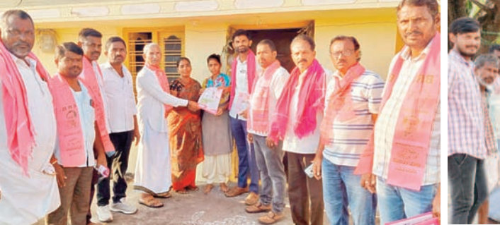
మరికల్ మండలంలో ప్రచారం చేస్తున్న బీఆర్ఎస్ నాయకులు