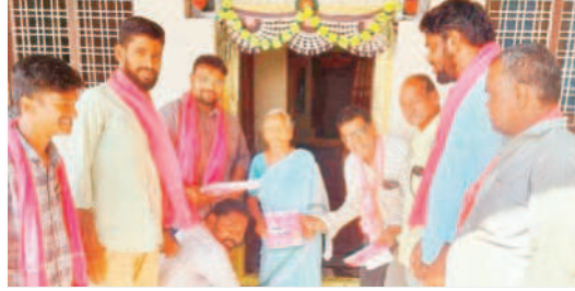
ధన్వాడలో ప్రచారం నిర్వహిస్తున్న బీఆర్ఎస్ నాయకులు