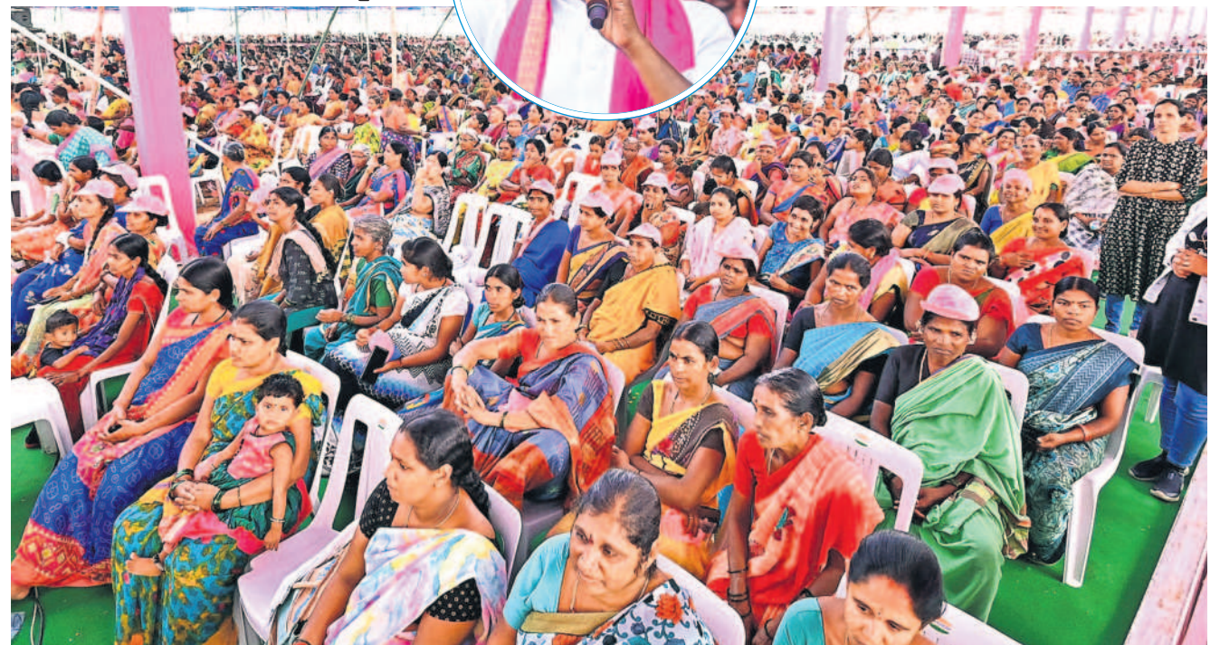
హాజరైన జనం ఆర్మూర్ సభకు హాజరైన జనం