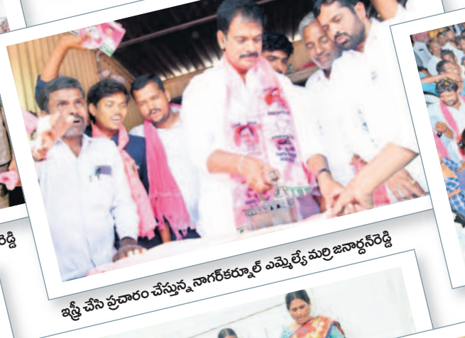
ఇటీవల ప్రచారం చేస్తున్న నాగర్ కర్నూల్ ఎమ్మెల్యే మర్రి జనార్ధన్ రెడ్డి