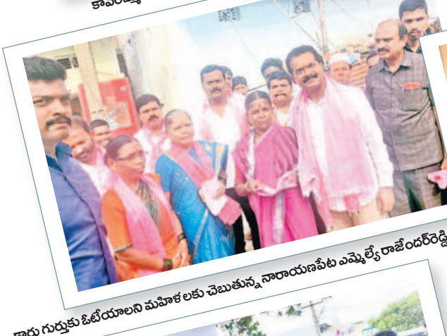
కారు గుర్తుకు ఓటియాలని మహిళలకు చెబుతున్న నారాయణపేట ఎమ్మెల్యే రాజేందర్ రెడ్డి