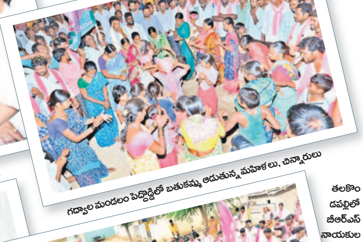
గద్వాల మండలం పెద్దొడ్డిలో బతుకమ్మ ఆడుతున్న మహిళలు, చిన్నారులు