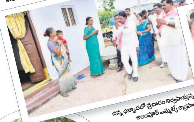
చిన్న ధన్యాడలో ప్రచారం నిర్వహిస్తున్న అలంపూర్ ఎమ్మెల్యే అబ్రహం