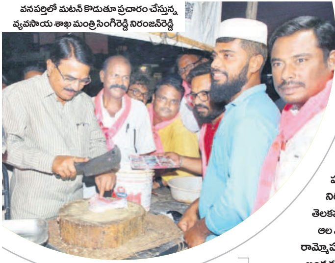
వనపర్తిలో మటన్ కొడుతూ ప్రచారం చేస్తున్న వ్యవసాయ శాఖ మంత్రి సింగిరెడ్డి నిరంజన్ రెడ్డి