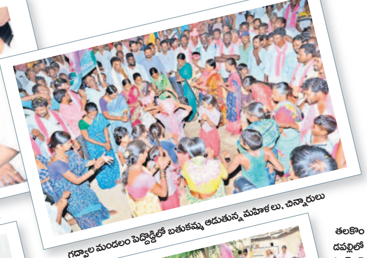
గద్వాల మండలం పెద్దొడ్డిలో బతుకమ్మ ఆడుతున్న మహిళలు, చిన్నారులు