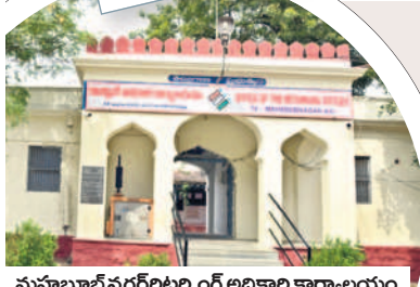
మహబూబ్ నగర్ రిటర్నింగ్ అధికారి కార్యాలయం