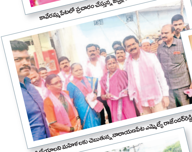
కారు గుర్తుకు ఓటియాలని మహిళలకు చెబుతున్న నారాయణపేట ఎమ్మెల్యే రాజేందర్ రెడ్డి