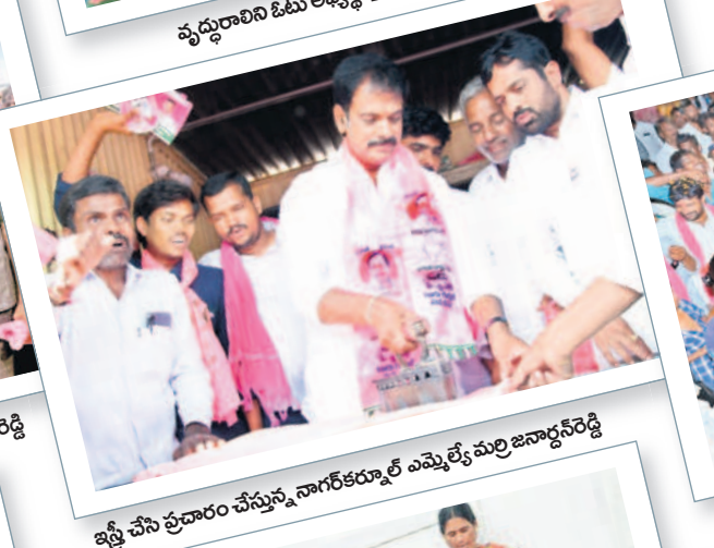
ఇస్టీ చేసి ప్రచారం చేస్తున్న నాగర్ కర్నూల్ ఎమ్మెల్యే మర్రి జనార్ధన్ రెడ్డి