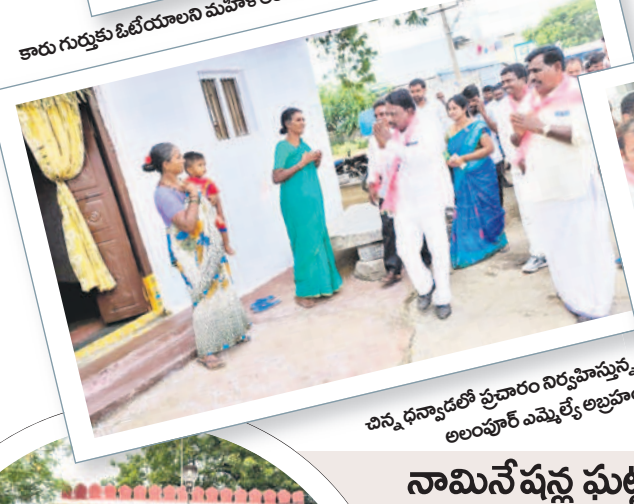
చిన్న ధన్యాడలో ప్రచారం నిర్వహిస్తున్న అలంపూర్ ఎమ్మెల్యే అబ్రహం