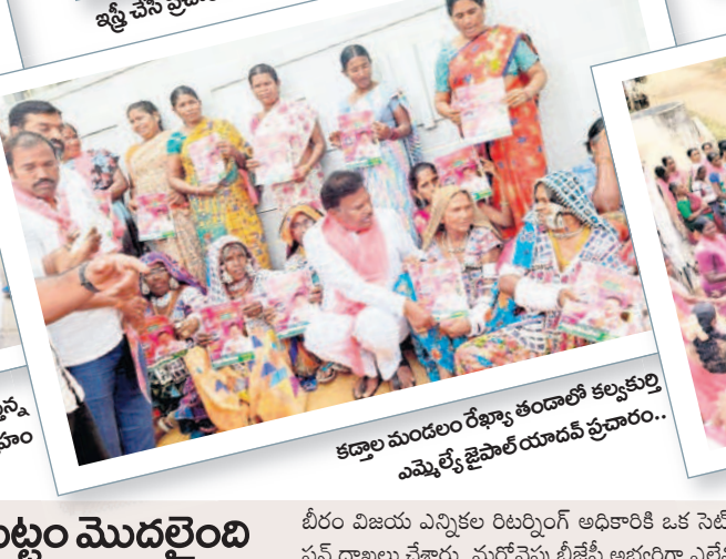
కడ్డాల మండలం రేఖ్యా తండాలో కల్వకుర్తి ఎమ్మెల్యే జైపాల్ యాదవ్ ప్రచారం..