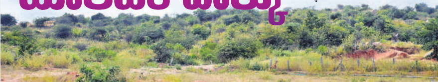
యాదగిరిగుట్ట మండలం దాతార్పల్లిలో టూరిజం పార్కు ఏర్పాటు చేసే ప్రదేశం

దాతార్పల్లిలో ఏర్పాటుకు వదివడిగా అడుగులు ఇప్పటికే 55 ఎకరాల స్థలం గుర్తింపు