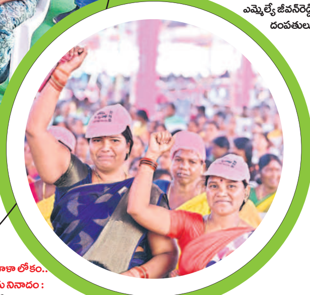
అటు మహిళా లోకం... ఇటు రైతు నినాదం: జై కేసీఆర్..