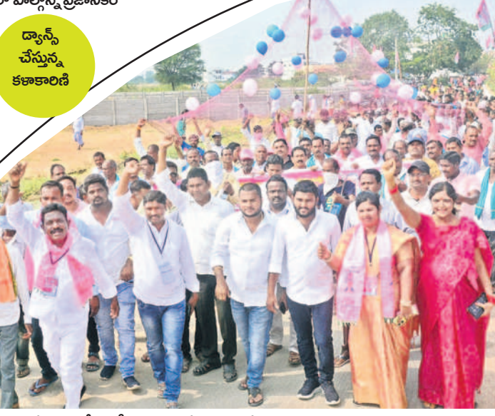
సభకు భారీ ర్యాలీగా తరలివస్తున్న గంగుత్తులు

ఆర్కార్ పట్టణ సమీపంలో శుక్రవారం నిర్వహించిన ప్రజా ఆశీర్వాద సభ గ్రాండ్ సక్సెస్ అయ్యింది. నియోజకవర్గంలోని అన్ని మండలాల నుంచి లక్షలాదిగా జనం తరలివచ్చారు. దారులన్నీ సిద్ధులగుట్ట బాట పట్టాయి. గులాబీ జెండాలు చేతపట్టు కొని, మెడలో కండువా వేసుకొని బీఆర్ఎస్ శ్రేణులు, ప్రజలు తరలిరావడంతో సభా ప్రాంగణం మొత్తం నిండిపోయింది. సీఎం కేసీఆర్, ఎమ్మెల్యే జీవన్ రెడ్డి ప్రసంగాన్ని ప్రజలంతా ఓపికగా విన్నారు. ఆర్కార్ ప్రజలు, రైతులు, అంకాపూర్ గ్రామంపై ఉన్న ప్రేమ, అభిమానాన్ని సీఎం కేసీఆర్ చెబుతున్నంతసేపు చప్పట్ల మోతమెగింది. ఎమ్మెల్యే జీవన్ రెడ్డిని కొనియాడుతూ ఆర్కార్ అభివృద్ధి కోసం ఆయనపడి తప నను వివరించారు. జనమంతా జయహో కేసీఆర్.. జై జీవన్ రెడ్డి అంటూ చేసిన నినాదాలతో సభా ప్రాంగణం దర్భరిల్లింది.