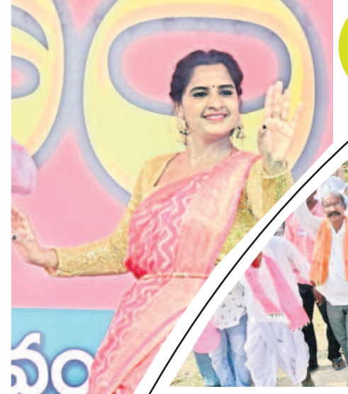
డ్యాన్స్ చేస్తున్న కళాకారిణి