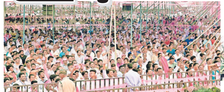
ప్రాంగణం పుల్... : ప్రజా ఆశీర్వాద సభలో పాల్గొన్న ప్రజానీకం