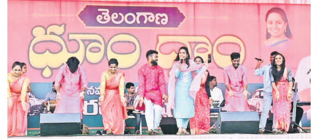
ఘాంధీ: పాటలు పాడుతూ డ్యాన్స్ చేస్తున్న కళాకారులు