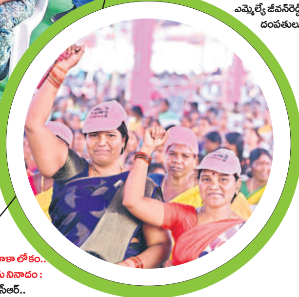
అటు మహిళా లోకం... ఇటు రైతు నినాదం: జై కేసీఆర్..