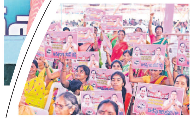
వెల్లువెత్తిన అభిమానం: సీఎం కేసీఆర్, ఎమ్మెల్యే జీవన్ రెడ్డి చిత్రాలతో ఉన్న షికార్లను ప్రదర్శిస్తున్న మహిళలు