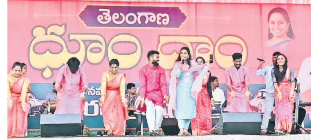
ఘాంధీ: పాటలు పాడుతూ డ్యాన్స్ చేస్తున్న కళాకారులు