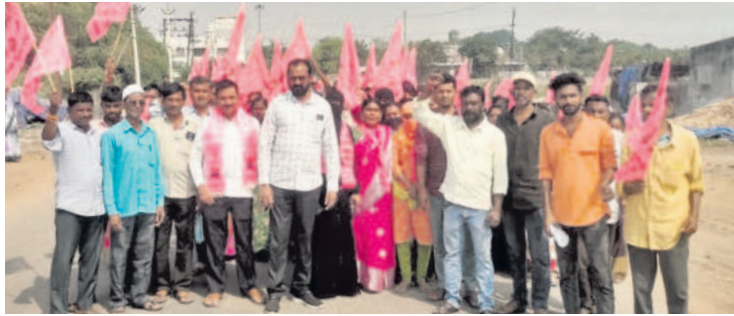
బోధన్లోని 15వ వార్డులో ప్రచారం నిర్వహిస్తున్న నాయకులు