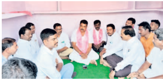
మోకన్పల్లి గ్రామంలో సమావేశంలో మాట్లాడుతున్న సర్పంచి రావు