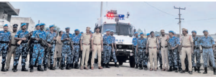
సాటాపూర్లో ప్రజలకు అవగాహన కల్పిస్తున్న ఏసీపీలు