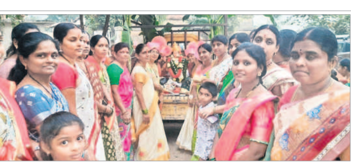
బోధన్ పట్టణంలోని వాచిడి వద్ద శారదా మహిళా మండలి ఆధ్వర్యంలో శ్రీ శారదాదేవీ ఉత్సవాలను ఐదు రోజుల పాటు ఘనంగా నిర్వహించారు. గత నెల 30న అమ్మవారి విగ్రహాన్ని ప్రతిష్ఠించి నిత్యపూజలతో పాటు వివిధ ఆధ్యాత్మిక, సాంస్కృతిక కార్యక్రమాలను నిర్వహించారు. ఐదు రోజు శుక్రవారం అమ్మవారి విగ్రహంతో శోభాయత్ర నిర్వహించి పాండు చెరువులో నిమజ్జనం చేశారు. -శకల్ నగర్, నవంబర్ 3