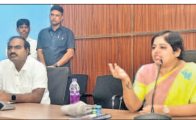
సెక్టోరియల్ సిబ్బందిని ఉద్దేశించి మాట్లాడుతున్న కలెక్టర్ భారతిహోలీకేరి