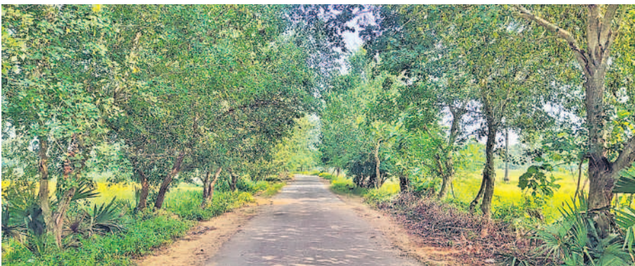
బివ్వెల మండలం ఖాసింపేట నుంచి మోదినపూరం వెళ్లే రోడ్డు వెంట ఏవైనా పెరిగిన హరితహారం చెట్లు