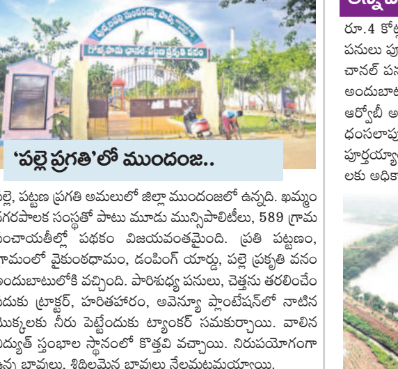
'పల్లె ప్రగతి'లో ముందంజ..

ఖమ్మం, నవంబర్ 4 (సమస్త తెలంగాణ ప్రతినిధి): ముఖ్యమంత్రి కేసీ ఆర్, రాష్ట్ర మున్సిపల్ లోకాభి మంత్రి కేటీ ఆర్ సహాయ సహకారాలతో ఖమ్మం జిల్లా అభివృద్ధిలో దూసుకుపోతున్నది. అన్నిరంగాల్లో ముందంజలో నిలుస్తున్నది. ప్రభుత్వం విడుదల చేసిన నిధులను అధికారులు, సర్వినయోగం చేసుకుని గ్రామాలు, పట్టణాలను ప్రగతి బాట పట్టిస్తున్నారు. అంతే కాదు సీఎం కేసీఆర్ జిల్లాకు ప్రత్యేకంగా నిధులు కేటాయిస్తున్నారు. ముఖ్యమంత్రి ప్రత్యేక నిధుల నుంచి 589 పంచాయతీల అభివృద్ధికి ఒక్కో పంచాయతీకి రూ.10 లక్షలు, మేజర్