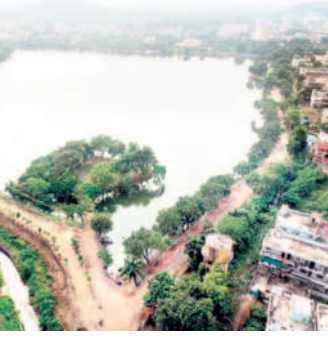
ఇంటింటికీ 'మిషన్ భగీరథ'..

రూ.4 కోట్లతో నగరంలోని లకారం చెరువు సుందరీకరణ పనులు పూర్తయ్యాయి. రూ.100 కోట్ల నిధులతో గోశిపాడు కానల్ పనులు పూర్తయ్యాయి. వానల్పై సుందర వనాలు అందుబాటులోకి వచ్చాయి. రూ.70 కోట్లతో ధంసలాపురం ఆర్కేసీ అందుబాటులోకి వచ్చింది. మున్నాపానగర్ నుంచి ధంసలాపురం గేటు వరకు నాలుగు లైన్ల రహదారి పనులు పూర్తయ్యాయి. నగరంలోని టేకులపల్లిలో 1,210 కుటుంబాలకు అధికారులు డిటుల్ టెడ్ రూం ఇండ్లు అప్పగించారు.