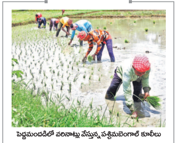
పెద్దమందడిలో వలసాట్లు వేస్తున్న పశ్చిమబెంగాల్ కూలీలు

ఎటమటం! షర్మల ఎవరో తెలియదా 'నెల్లూరు పెద్దారెడ్డి ఎవరో తెలియదా? అనలు మీలాంటి వారికి డిప్యూటీ వారల్ ఇచ్చినాడిని తప్పుపట్టాలి అంటూ సాగే 'అనగనగా ఒకరోజు' సినీమాలోని ప్రాసంగికం దైగాగి మనం వినే ఉంటాం. నెల్లూరు పెద్దారెడ్డి సంగతి తెలియదా? ఆ షర్మల ఎవరో తనకు తెలియదా? ఎంబిఎం అడివేత అనదుర్దీన్ ఓపైనే చేసిన తాజా వ్యాఖ్యలు చర్చనీయాంశంగా మారాయి. రాజస్థాన్ రాజ్యం పార్టీ అధ్యక్షులు రాజు సైఫ్ దిన్ పుల్లె కాంగ్రెస్ నకు మద్దతు ప్రకటించడం పట్ల సందేహాలకు తెలియదా? ఆని ప్రశ్నించారు. వైఎస్ రాజశేఖరెడ్డి కారకురు పర్మిట్ తెలియదా? ఆని ప్రశ్నిస్తే వైఎస్ బిడ్డ అయితే ఏం? ఆని ఎదురు ప్రశ్నించారు. అందరికీ తెలియదాని ఆమె పవనా తోపా అ సైఫ్ సురింత రెవ్విషోయారు. స్థిరత్వం లేకుండా షర్మల మాదిగా పూటకో మాట మాట్లాడేవారిని ఏ రంగంలోనైనా ఏమిదంగా చులకనగా చూస్తారో అందుకు ఓపైనే వ్యాఖ్యలే నిదర్శనం. కాగా వైఎస్ కుటుంబాన్ని కాంగ్రెస్ ఎన్నికల ఇబ్బందులు పెట్టింది తెలిసి కూడా షర్మల ఆ పార్టీకి మద్దతు ప్రకటించడాన్ని ఆమె విజ్ఞతకే వదిలేస్తున్నట్లు ప్రకటించిన వైఎస్ఆర్ఎస్ కుడా చాలా టైట్ తీసుకున్న విషయం తెలిసింది.