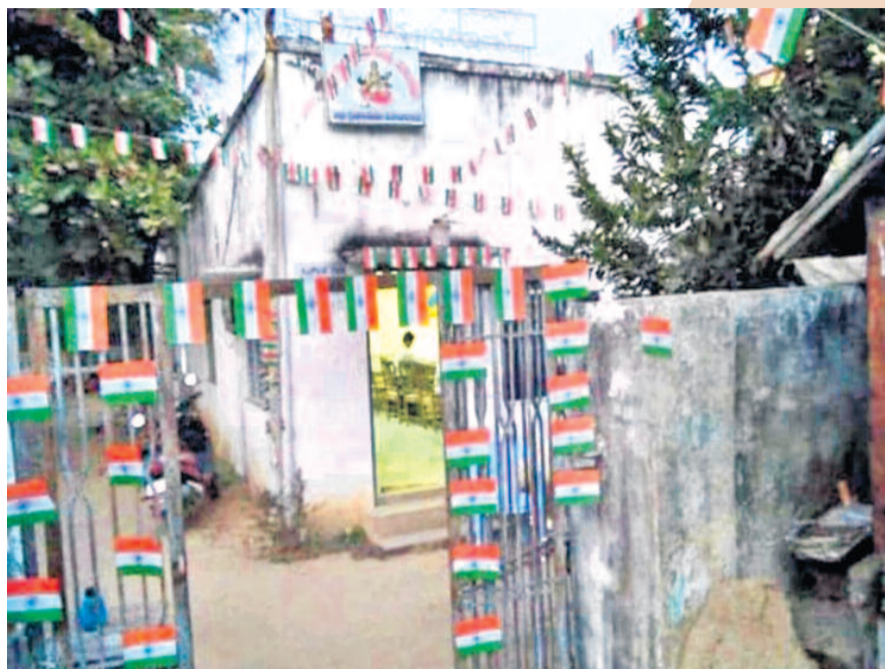
బాగుపడాలని కోరుకునేవాడికి అక్షరాన్ని మించిన అత్యున్నత మరెవరూ ఉండరు. వ్యక్తి సమగ్ర వికాసాన్ని లక్ష్యంగా మండలాలు జిల్లా కేంద్రాల్లో గ్రంథాలయాల ఏర్పాటు జరుగుతుంది. అయితే గత పాలకులు వీటి విషయంలోనూ నిర్లక్ష్య వైఖరినే చూపించారు. అంతంత మాత్రం వనతులు, అరకొర పుస్తకాలతో పాటు మధ్య భవంతుల్లో ఇవి ప్రాబల్యాన్ని కోల్పోయాయి. చిత్రంలో కనిపిస్తున్నది ఒకప్పటి మహాబాబాబాద్ జిల్లా గ్రంథాలయం!