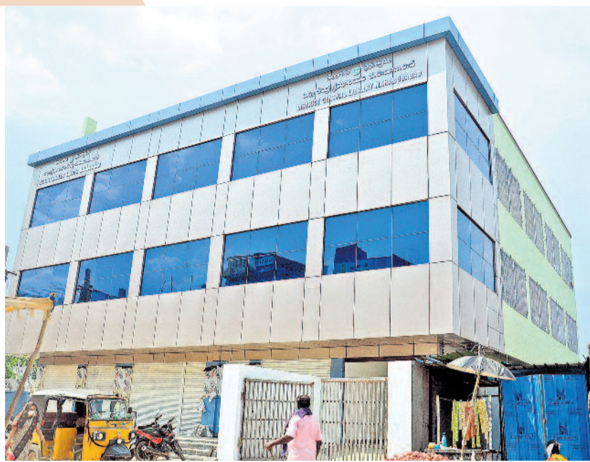
స్వరాష్ట్రంగా తెలంగాణ స్వర్ణయుగాన్ని చవిచూస్తున్నది. అక్షరాన్ని ప్రేమించే వ్యక్తి ముఖ్యమంత్రిగా రావడంతో గ్రంథాల యాలకూ దశ తిరిగింది. రేకుల పెట్టె, పెంకుటిండ్లలోని పుస్తకాలయాల అధునాతన భవంతుల్లో చేరిపోయాయి. మహాబాబాబాద్ గ్రంథాలయానికీ మహారాష్ట్ర వట్టింది. బీఆర్ఎస్ సర్కారు ఇక్కడ రూ. 2.90 కోట్లతో మూడంతస్తుల్లో పుస్తక సౌధాన్ని నిర్మించింది. దీంతో వేల పుస్తకాలు పాఠకులకు చేరువయ్యాయి. పోటీ పరీక్షలకు వెళ్లే విద్యార్థులయినా, పుస్తకాన్ని ప్రేమించే పెద్దవ్యాసాన్ని ఇప్పటికీ వెళ్లి నచ్చిన పుస్తకాన్ని హామీగా పడపుకోవచ్చు.