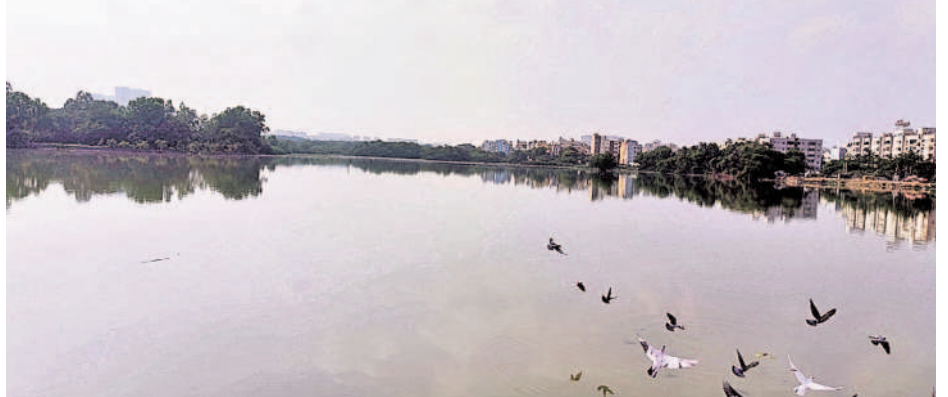
కూకట్పల్లిలోని రంగధాముని చెరువు

• కూకట్పల్లి రంగధాముని (ఐడిఎల్) చెరువును మినీ ట్యాంక్ బండగా తీర్చిదిద్దే పనులు వేగంగా సాగుతున్నాయి. ఈ చెరువు సుందరికరణ కోసం రూ.50 కోట్లతో ప్రణాళికలు సిద్ధం చేయగా ఇప్పటికే రూ.8 కోట్లతో చేపట్టిన రంగధాముని ఫ్రంట్ లేక్ పార్కును ప్రత్యేకంగా అభివృద్ధి చేశారు. చెరువులోకి మురుగునీరు చేరకుండా ప్రత్యేక పైప్ లైన్ నిర్మాణం కోసం రూ.19.3 కోట్లు కేటాయించగా ఈ పనులు మొదలయ్యాయి. • కేపీహెచ్బీ కాలనీ సమీపంలోని ముఖ్యకర్త్య చెరువు చుట్టూరా కంచెను ఏర్పాటు చేస్తూ దానికనుగుణంగా వాకింగ్ ట్రాక్ ను ఏర్పాటు చేస్తున్నారు. • సున్నం, కాముని, మైసమ్మ చెరువుల పరిరక్షణ కోసం చెరువుల చుట్టూరా కంచెను ఏర్పాటు చేసి వాకింగ్ ట్రాక్ లను ఏర్పాటు చేస్తున్నారు.