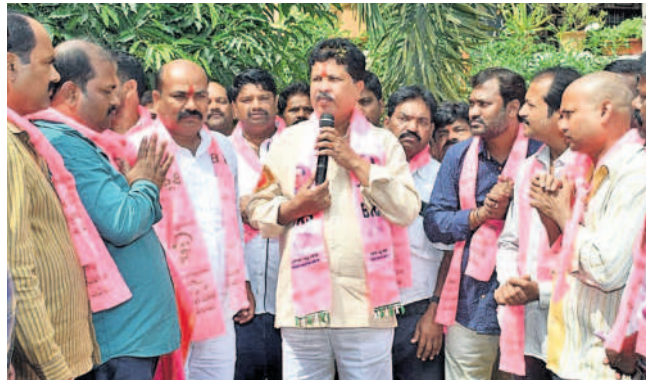
కృష్ణారావుకు మద్దతు తెలుపుతున్న బాలానగర్ నాయా బ్రాహ్మణ సంఘం సభ్యులు