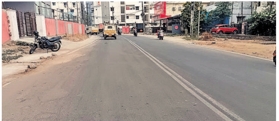
జేపీనగర్లో నూతనంగా వేసిన బీటీరోడ్డు

శేరిలింగంపల్లి నియోజకవర్గంలోని పదిన్నర డివిజన్లలో అంతర్గత రహదారుల పరిస్థితి గడచిన తొమ్మిదేండ్లగా ఎంతో మెరుగు పడింది. అస్తవ్యస్త రహదారులు, గతుకుల దారులతో