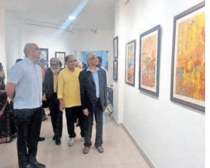
చిత్రాలను తిలకిస్తున్న ప్రముఖులు