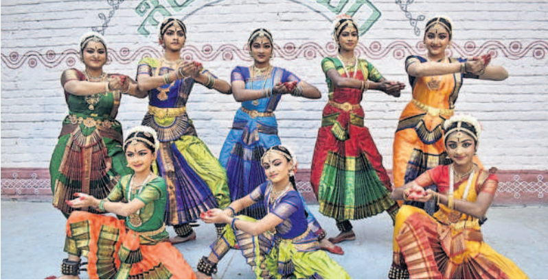
నృత్య ప్రదర్శనలిస్తున్న కళాకారులు

కొండాపూర్, నవంబర్ 4 : వారాంతపు సాంస్కృతిక ప్రదర్శనల్లో శనివారం మాదాపూర్లోని శిల్పారామంలో పలువురు కళాకారులు గాత్ర, నృత్య ప్రదర్శనలతో ఆధ్యాత్మిక ఆకట్టుకున్నారు. సుమధుర సంగీత స్వరధరా సంగీత కళాకారులు తమ గాత్ర కచేరీతో సందర్భాలకు అక్షరాన్ని పంచారు. గరుడగమనా, సువ్వి సువ్వి, జయ జయ, కళ్యాణ గణనిధి కీర్తనలను ఆలపించారు. అనంతరం తిల్లాన ఆర్ట్స్ అకాడమీ