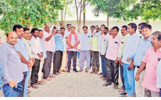
మరిపెడలో డిర్లకర్ అభ్యర్థి రెడ్డాకు మద్దతు ప్రకటిస్తున్న రేపనడిలర్లు

గడపగడపకూ బిఆర్ఎస్.. ఉమ్మడి జిల్లా అంతటా ప్రచార జోరు.. అభివృద్ధికి పట్టంకట్టాలని విజ్ఞప్తి