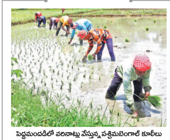
పెద్దమండలిలో వలసాట్లు వేస్తున్న పశ్చిమబెంగాల్ కూలీలు

దశాబ్దాలుగా ఇక్కడ తిప్పే వేసిన కరువు తెలంగాణ వచ్చాక పరాగైంది. ముఖ్యమంత్రి కేసీఆర్ స్వంతం.. పాలమూరు ప్రజలు కలలోనూ ఊహించని రీతిలో ఆ ప్రాంతం తీరుతున్నట్లు మార్చేసింది. నేలంతా ఈనిండా అన్నట్టుగా లక్షలాది ఎకరాల్లో ధాన్యనిలి చిందులేస్తున్నది. ఇప్పుడు పరాయి రాష్ట్రాల నుంచి వలసాచ్చిన వారికి అన్నం పెడుతున్నది. 'నింగీచూరులోని చుక్కలన్ని జాలి.. నేలదారిలోన నీటిపూలై పాలి.. వరదపాంసు నీరు వలికిన ఏరు.. ఎత్తిపోతల ఏటి తాళ మేసింది.. పాలమూరును తాకి పరవశించింది' అన్న గొరటి వెంకన్న పాట.. ఉమ్మడి మహబూబ్ నగర్ జిల్లాకు జిఆర్ఎస్ ప్రభుత్వం తెచ్చిపెట్టిన అద్దపాల్లి ఎలుగిత్తి చాటుతున్నది.