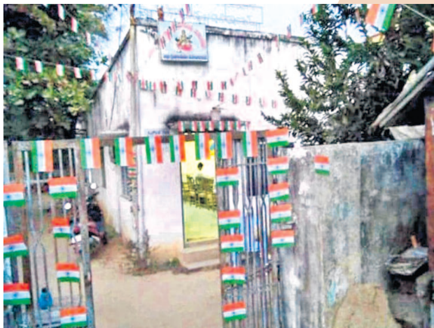
బాగుపడాలని కోరుకునేవాడికి అక్షరాన్ని మించిన అత్యున్నత మరెవరూ ఉండరు. వ్యక్తి సమగ్ర వికాసాన్ని లక్ష్యిస్తూ మండలాల జిల్లా కేంద్రాల్లో గ్రంథాలయాల ఏర్పాటు జరుగుతుంది. అయితే గత పాలకులు వీటి విషయంలోనూ నిర్లక్ష్య వైఖరినే చూపించారు. అంతంత మాత్రం వనతులు, అరకొర పుస్తకాలతో పాటు మధ్య భవంతుల్లో ఇవి ప్రాబంధాన్ని కోల్పోయాయి. చిత్రంలో కనిపిస్తున్నది ఒకప్పుటి మహబూబాబాద్ జిల్లా గ్రంథాలయం!