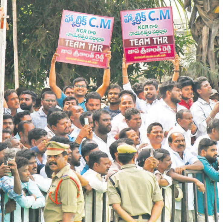
హ్యూట్రీక్ సీఎం కేసీఆర్ అంటూ షకార్తులు ప్రదర్శిస్తున్న బీఆర్ఎస్ కార్యకర్తలు