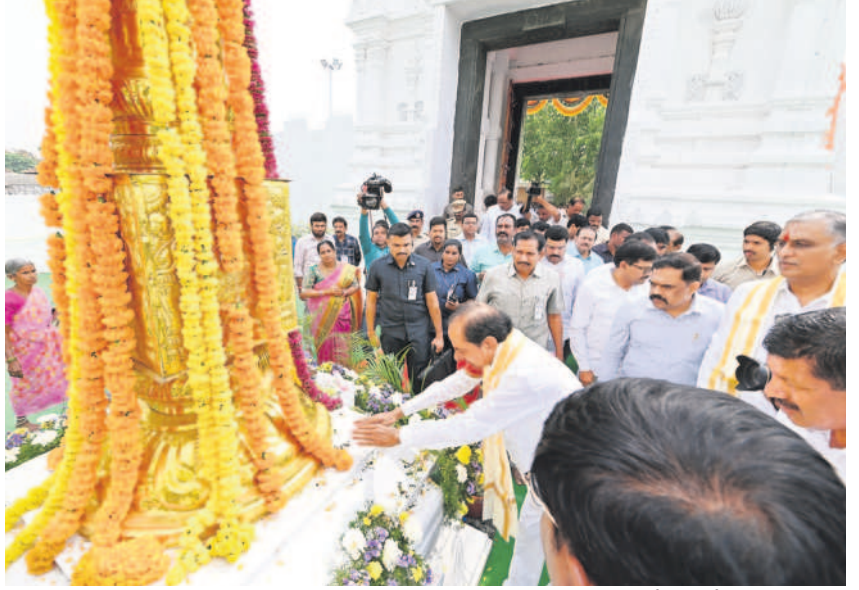
కోనాయిపల్లి వేంకటేశ్వరస్వామి ఆలయంలో భృంజనానికి మొక్కుతున్న సీఎం కేసీఆర్