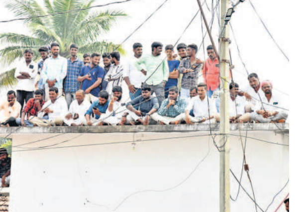
అభిమాన నేతను చూసేందుకు ఓ ఇంటి దాబాపైకి ఎక్కిన గ్రామస్థులు