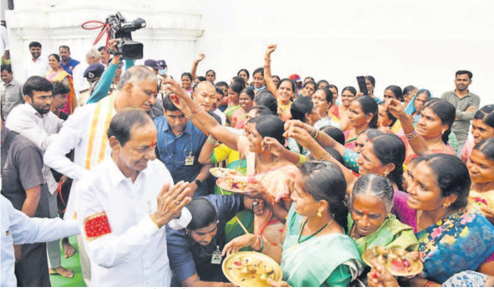
కోనాయిపల్లిలో సీఎం కేసీఆర్, మంత్రి హరీశ్ రావులకు తిలకం దిద్దుతున్న మహిళలు