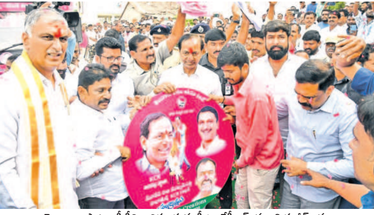
తెలంగాణ పాటల సీడీని ఆవిష్కరిస్తున్న సీఎం కేసీఆర్, మంత్రి హరీశ్ రావు