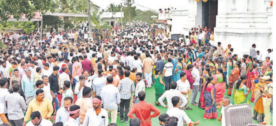
సీఎం కేసీఆర్ కు స్వాగతం పలికేందుకు ఆలయం వద్దకు చేరుకున్న బీఆర్ఎస్ శ్రేణులు, కార్యకర్తలు