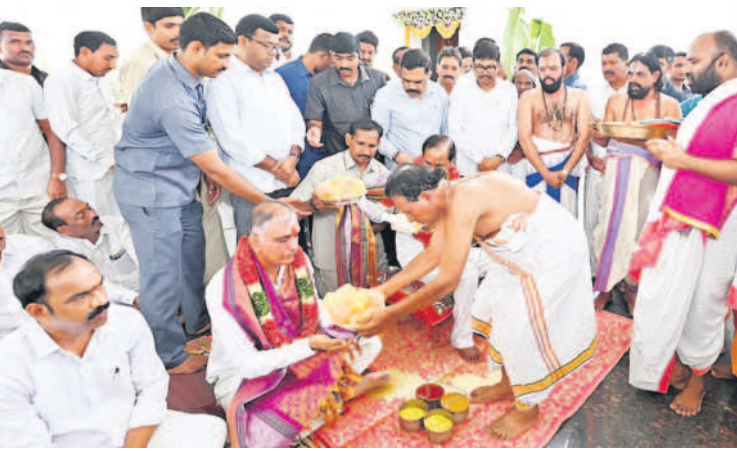
కోనాయిపల్లిలో సీఎం కేసీఆర్, మంత్రి హరీశ్ రావుకు ప్రసాదాలు అందజేస్తున్న అర్చకులు