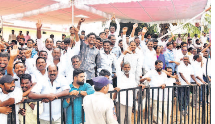
సీఎం కేసీఆర్ ను మాస్తూ కేరింతులు కొడుకున్న యువకులు, కార్యకర్తలు