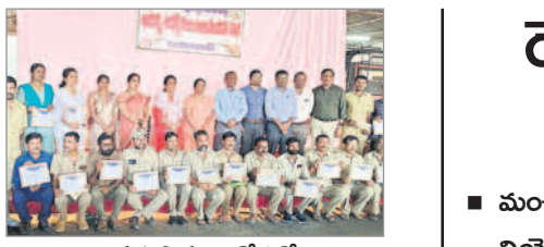
అవార్డుల ప్రశంసాపత్రాలతో ఉద్యోగులు