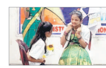
డ్రామా ప్రదర్శిస్తున్న విద్యార్థులు

మంచెర్యాల అర్బన్, నవంబర్ 4 : జిల్లా కేంద్రంలోని సైన్స్ సెంటర్లో శనివారం జిల్లా స్టాయి సైన్స్ డ్రామా పోటీలు అట్టహాసంగా జరిగాయి. మానవ జాతి ప్రయోజనం కోసం సైన్స్ అండ్ టెక్నాలజీ అనే ముఖ్య అంశంతో మిల్టెన్స్ ద సూపర్ పుడ్, ఆహార భద్రత రోజు వారి జీవితంలో ఆధునిక సాంకేతికత, ఆరోగ్య సంరక్షణలో ప్రస్తుత పురోగతులు, సమాజంలో మూఢనమ్మకాలు అనే ఉప అంశాలపై జరిగిన సైన్స్ డ్రామా పోటీలు నిర్వహించారు. విద్యార్థుల్లో ప్రయోగ వైపునాటి పెంపొందించడమే ధ్యేయం కాకుండా సమాజంలోని సమస్యలకు పరిష్కారాలను చూపేటూ విద్యార్థులు నాటిక రూపంలో ప్రదర్శించారు.