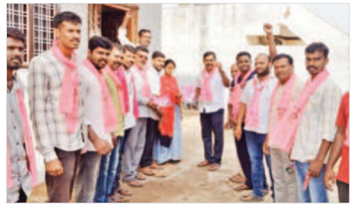
కొత్తకోట : ప్రచారం చేస్తున్న నాయకులు