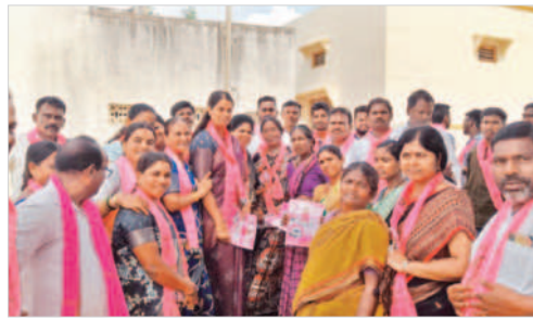
కొత్తకోట : ఇంటింటి ప్రచారం చేస్తున్న ఆల మంజుల