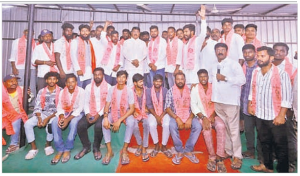
మంత్రి సమక్షంలో బీఆర్ఎస్ లో చేరిన వివిధ పార్టీల నాయకులు