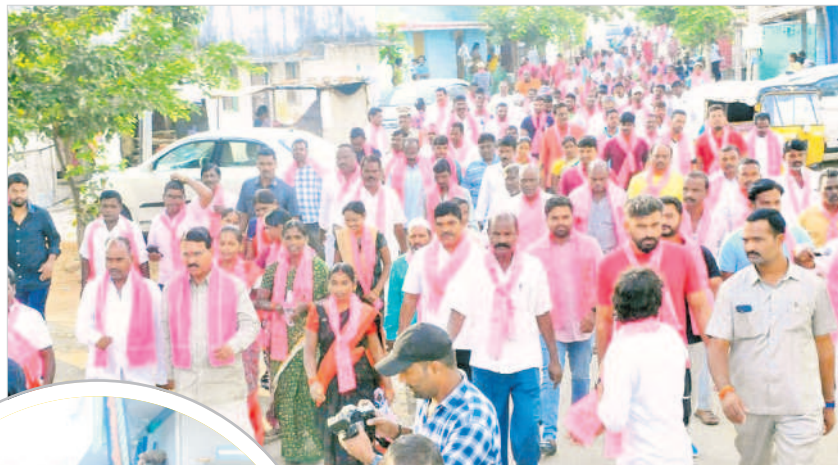
దళితవాడలో ఇంటింటి ప్రచారం చేస్తున్న మంత్రి