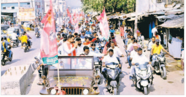
వనపర్తిలో భారీ రా్యాలీ నిర్వహిస్తున్న బీఆర్ఎస్ యువకులు