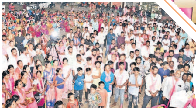
బీకే రెడ్డి కాలనీలో ప్రచారానికి హాజరైన ప్రజలు