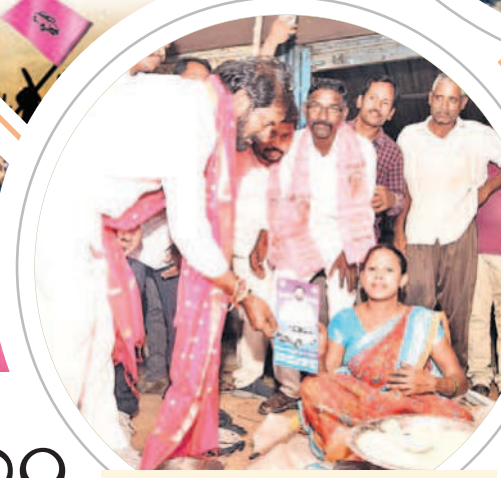
కారుగుర్తుకు ఓటియాలని భగవంతుని కాలనీలో రొట్టెలు చేస్తున్న మహిళలను అభ్యర్థిస్తున్న మంత్రి శ్రీనివాస్ గౌడ్