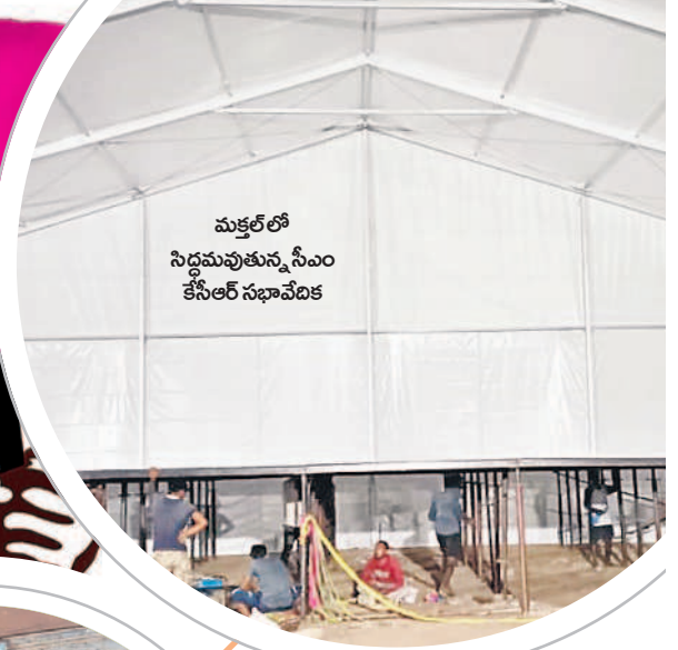
మక్తల్లో సిద్ధమవుతున్న సీఎం కేసీఆర్ సభావేదిక