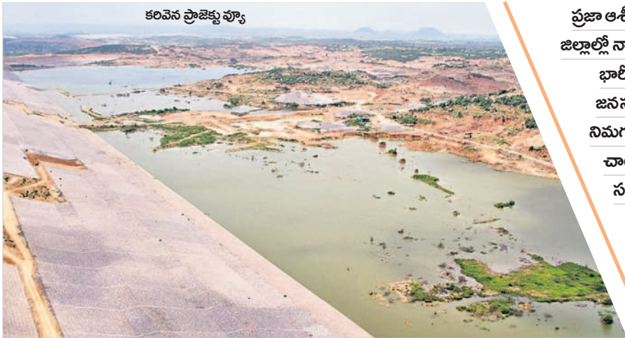
కరివెన ప్రాజెక్టు వూరూ

బీఆర్ఎస్ సర్కారు హామీ ఇచ్చిందంటే తప్పక నెరవేరుస్తుందన్న నమ్మకం ప్రజల్లో బలంగా ఉన్నది. అందుకు తగ్గట్లుగానే గత ఎన్నికల సమయంలో, జిల్లాలకు వచ్చినప్పుడు ముఖ్యమంత్రి కేసీఆర్ ఇచ్చిన వాగ్దానాల్ని అమల్లోకి తీసుకొచ్చారు. ఈ మేరకు దేవరకర్ణ నియోజకవర్గంలో పర్యటించి పాలమూరు-రంగారెడ్డి ఎత్తిపోతలలో భాగంగా రూ.3,300 కోట్లతో కరివెన ప్రాజెక్టుకు శ్రీకారం చుట్టారు. పనులన్నీ దాదాపుగా పూర్తి కాగా.. త్వరలోనే కృష్ణాజలాలతో నింపనున్నారు. మక్తల్ నియోజకవర్గంలో ఇచ్చిన మాట ప్రకారం రెండు లక్షల ఎకరాలకు సాగునీరందించారు. నారాయణపేటకు వచ్చిన సమయంలో జిల్లాగా ఏర్పాటు చేస్తానని ప్రకటించి.. అమలు చేయడంతో ప్రగతి పరుగులు పెడుతున్నది. పీఆర్ఎల్లో భాగంగా కాల్య పనులకు టెండర్లు పూర్తి కాగా.. త్వరలోనే జయమ్మ చెరువును కృష్ణాజలాలు చేరనున్నాయి.