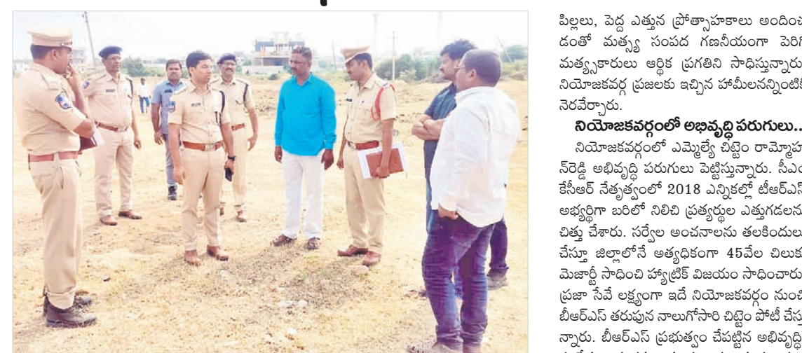
మక్కల్ లో సీఎం కేసీఆర్ ప్రజా ఆశీర్వాద సభా ఏర్పాటు పరిశీలిస్తున్న అధికారులు