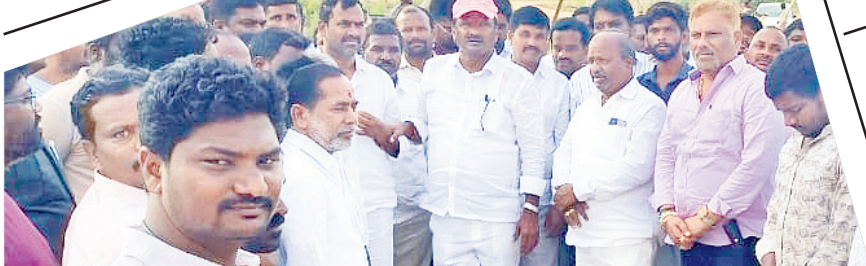
దేవరకర్ణుల సీఎం కేసీఆర్ ఐహారంగం సభా స్థలాన్ని పరిశీలిస్తున్న ఎమ్మెల్యేల అంకెలతో శర్వరిద్దీ

మహబూబ్ నగర్, నవంబర్ 4 (నమస్తే తెలంగాణ ప్రతినిధి) : టీఆర్ఎస్ అధినేత.. ప్రగతి ప్రధాన సీఎం కేసీఆర్ ఈనెల 6న ఉమ్మడి జిల్లాలో ఒకేరోజు మూడు జిల్లాల్లో, నాలుగు ఐహారంగం సభల్లో పాల్గొననున్నారు. ఒకే రోజు నాలుగు చోట్ల ప్రజాఆశీర్వద సభల్లో పాల్గొంటుండడంతో రాజకీయ ప్రాధాన్యత సంతరించుకున్నది. నామినేషన్ల పుట్టం ఊపందుకున్న తరుణంలో పార్టీ అధినేత పర్యటనను ప్రతిష్టాత్మకంగా తీసుకొని ఏర్పాట్లు చేస్తున్నారు. ఇప్పటికే సీఎం కేసీఆర్ ఉమ్మడి జిల్లాలో మూడు చోట్ల ప్రజా ఆశీర్వాద సభల్లో పాల్గొన్నారు. ఎన్నికల పెద్దయ్యాల్లో ప్రకటించాగానే గత నెల 1న జన్మదిన పట్టణంలో భారీ బహారంగం సభలో పాల్గొని ఉమ్మడి జిల్లాలో ఎన్నికల శంఖారావాన్ని పూరించారు. అదే నెల 26న అప్పంపేట, వనపర్తి నియోజకవర్గాల్లో పర్యటించి రాజకీయ వేడిని రగిలించారు. సోమవారం మహబూబ్ నగర్ జిల్లా దేవరకర్ణుల, జోగులాంబ గద్వాల జిల్లా కేంద్రంలో, నారాయణపేట జిల్లా కేంద్రంలోపాటు మక్కల్లో భారీ బహారంగం సభలు ఏర్పాటు చేస్తున్నారు. ఒకే రోజు నాలుగు సభల్లో గులాబీ పార్టీ అధినేత అభ్యర్థుల తరపున ప్రచారం చేస్తుండడంతో పార్టీ నాయకులు విస్తృత ఏర్పాట్లు చేస్తున్నారు. ఇప్పటికే సభలు నిర్వహించే స్థలాలను చదును చేసి హెలిపాడ్లు ఏర్పాటు పైసలే చేశారు. నాలుగు చోట్ల పార్టీ అభ్యర్థులు పోటాపోటీగా ప్రచారం సభలను విజయవంతం చేసేందుకు శ్రమిస్తున్నారు. ఒకవైపు ప్రచారం చేస్తూనే మరోవైపు సీఎం సభకు జనన మీకరణ చేసేందుకు కనరత్న చేస్తున్నారు. ఆయా నియోజకవర్గాల్లోని పార్టీ అభ్యర్థులు, ఇన్చార్జీలు, ప్రజా ప్రతినిధులు, నాయకులు మండలాల వారీగా భారీ పట్టు కార్యక్రమం