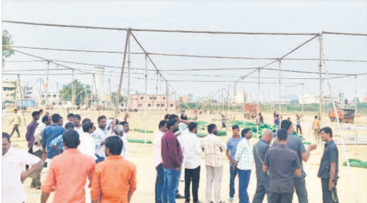
దేవరకర్ణుల సీఎం కేసీఆర్ సభారంగం ఏర్పాటు చేస్తున్న అధికారులు, ప్రజాప్రతినిధులు

మహబూబ్ నగర్, నవంబర్ 4 (నమస్తే తెలంగాణ ప్రతినిధి) : టీఆర్ఎస్ అధినేత.. ప్రగతి ప్రధాన సీఎం కేసీఆర్ ఈనెల 6న ఉమ్మడి జిల్లాలో ఒకేరోజు మూడు జిల్లాల్లో, నాలుగు ఐహారంగం సభల్లో పాల్గొననున్నారు. ఒకే రోజు నాలుగు చోట్ల ప్రజాఆశీర్వద సభల్లో పాల్గొంటుండడంతో రాజకీయ ప్రాధాన్యత సంతరించుకున్నది. నామినేషన్ల పుట్టం ఊపందుకున్న తరుణంలో పార్టీ అధినేత పర్యటనను ప్రతిష్టాత్మకంగా తీసుకొని ఏర్పాట్లు చేస్తున్నారు. ఇప్పటికే సీఎం కేసీఆర్ ఉమ్మడి జిల్లాలో మూడు చోట్ల ప్రజా ఆశీర్వాద సభల్లో పాల్గొన్నారు. ఎన్నికల పెద్దయ్యాల్లో ప్రకటించాగానే గత నెల 1న జన్మదిన పట్టణంలో భారీ బహారంగం సభలో పాల్గొని ఉమ్మడి జిల్లాలో ఎన్నికల శంఖారావాన్ని పూరించారు. అదే నెల 26న అప్పంపేట, వనపర్తి నియోజకవర్గాల్లో పర్యటించి రాజకీయ వేడిని రగిలించారు. సోమవారం మహబూబ్ నగర్ జిల్లా దేవరకర్ణుల, జోగులాంబ గద్వాల జిల్లా కేంద్రంలో, నారాయణపేట జిల్లా కేంద్రంలోపాటు మక్కల్లో భారీ బహారంగం సభలు ఏర్పాటు చేస్తున్నారు. ఒకే రోజు నాలుగు సభల్లో గులాబీ పార్టీ అధినేత అభ్యర్థుల తరపున ప్రచారం చేస్తుండడంతో పార్టీ నాయకులు విస్తృత ఏర్పాట్లు చేస్తున్నారు. ఇప్పటికే సభలు నిర్వహించే స్థలాలను చదును చేసి హెలిపాడ్లు ఏర్పాటు పైసలే చేశారు. నాలుగు చోట్ల పార్టీ అభ్యర్థులు పోటాపోటీగా ప్రచారం సభలను విజయవంతం చేసేందుకు శ్రమిస్తున్నారు. ఒకవైపు ప్రచారం చేస్తూనే మరోవైపు సీఎం సభకు జనన మీకరణ చేసేందుకు కనరత్న చేస్తున్నారు. ఆయా నియోజకవర్గాల్లోని పార్టీ అభ్యర్థులు, ఇన్చార్జీలు, ప్రజా ప్రతినిధులు, నాయకులు మండలాల వారీగా భారీ పట్టు కార్యక్రమం