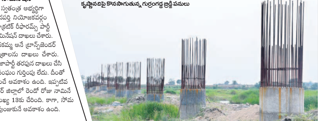
కృష్ణానదిపై సాగునీరును, గుర్రంగడ్డ బ్రద్ది పనులు