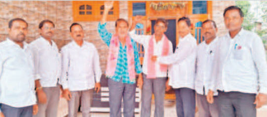
పార్టీ కండువా కప్పి పార్టీలోకి ఆహ్వానిస్తున్న కౌన్సిలర్లు