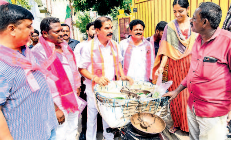
10వ డివిజన్లో ప్రచారంలో భాగంగా ప్రజలకోరిక ముచ్చటొస్తున్న వరంగల్ పశ్చిమ అభ్యర్థి దాస్యం