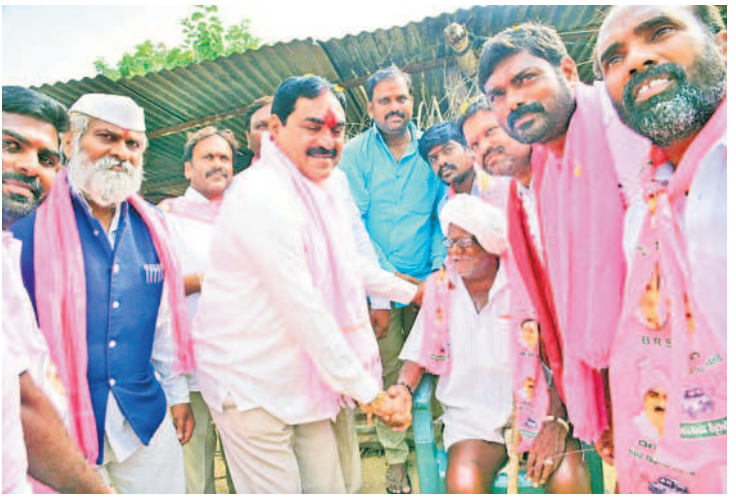
పెద్దవంగర : కాన్వాయిగూడెంలో వృద్ధుడిని ఆహ్వానంగా పలుకరించి ఓటు అడుగుతున్న మంత్రి ఎర్రబెల్లి

- అక్షయ్ కోటి, నర్సింహలపేట, మహబూబాబాద్ జిల్లా