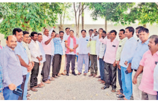
మలపేడలో డోర్లకర్ అభ్యర్థి రెడ్డాకు మద్దతు ప్రకటిస్తున్న రేపనడిలర్లు

గడపగడపకూ బిఆర్ఎస్.. ఉమ్మడి జిల్లా అంతటా ప్రచార జోరు.. అభివృద్ధితో పట్టంకట్టాలని విజ్ఞప్తి