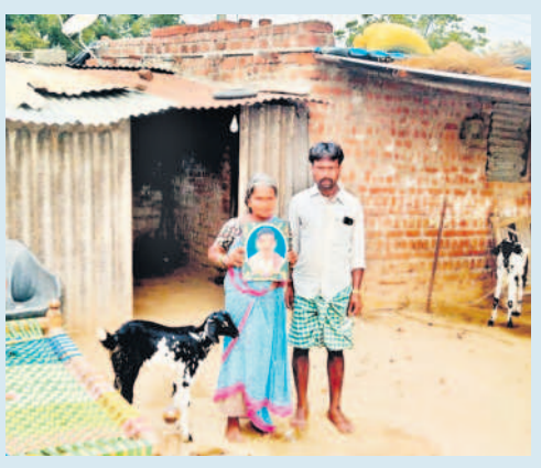
బిచ్చ ఫాటోతో భార్య కోటి, కుమారుడు కొటయ్య

ఉమ్మడి జిల్లాలో ఒక్క కరెంటు కాటుకు 142 మంది బలి పాముకాట్ల దావులకు లెక్కలేదు ఇప్పటి పరిస్థితి ఉంటే తమవాళ్లు బతికి ఉంటుండే అంటున్న కుటుంబాలు వ్యవసాయరంగ ప్రగతిని మార్చిన ఉచిత కరెంటు కరువును దూరం చేసిన విప్లవాత్మక మార్పు కాంగ్రెస్ పాలనలో రైతు'బ'.. టీఆర్ఎస్ పాలనలో బాహుబలి