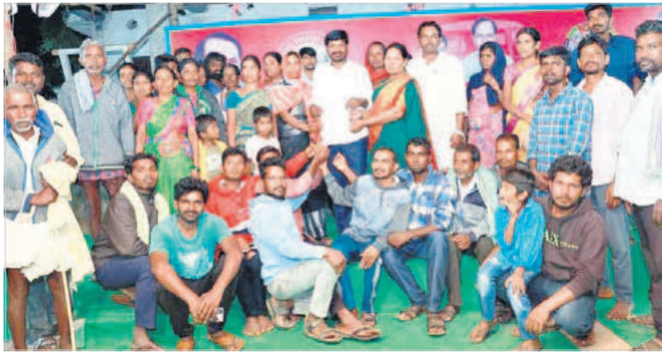
ప్రభుత్వ విప్, ఎమ్మెల్యే గువ్వల బాలరాజుకు ఓకగ్రీవ తీర్మానపత్రాన్ని అందజేస్తున్న పెట్రోల్ చేసు ప్రజలు

అమ్రాబాద్, నవంబర్ 4 : కాంగ్రెస్ చెప్పే మాయమాటలను ప్రజలు నమ్మే పరిస్థితిలో లేరని ప్రభుత్వ విప్, ఎమ్మెల్యే గువ్వల బాలరాజు అన్నారు. శనివారం పదర్ మండలంలోని రాయలగండితండా, పెట్రోల్ చేసుకు గ్రామాలకు చెందిన కాంగ్రెస్ నాయకులు, కార్యకర్తలు అచ్చం పేటలో ఎమ్మెల్యే గువ్వల సమక్షంలో బీఆర్ఎస్ లో చేరారు. వీరికి గువ్వల గులాబీ కండువలు కప్పి పార్టీలోకి సాదరంగా ఆహ్వానించారు. ఈ సందర్భంగా ఎమ్మెల్యే గువ్వల మాట్లాడుతూ కాంగ్రెస్ పార్టీ మాజీ ఎమ్మెల్యే వంశీకృష్ణ ప్రజలకు మాయమాటలు చెప్పి పార్టీలో చేర్చుకుంటున్నారని బీఆర్ఎస్ పార్టీ కార్యకర్తలకు బలవంతంగా కాంగ్రెస్ కండువలు కప్పి మోసం చేస్తున్నారని ఆరోపించారు. మాయమాటలతో ప్రజలను మోసం చేయలేరని బలవంతంగా ఎవరినీ తమవైపు తిప్పుకోలేరని చెప్పారు. రాయలగండి తండాకు చెందిన కొంత మంది బీఆర్ఎస్ నాయకులను అడ్డదారిలో తమ వైపు తిప్పుకోవాలని చూసిన వారు తిరిగి బీఆర్ఎస్ లోనే చేరాలని కాంగ్రెస్ కుట్రలను వారు తిప్పికొట్టారని ఆయన గుర్తు చేశారు. అదేవిధంగా పెట్రోల్ చేసు ప్రజలు అందరూ అచ్చంపేట నియోజకవర్గ అభివృద్ధికి