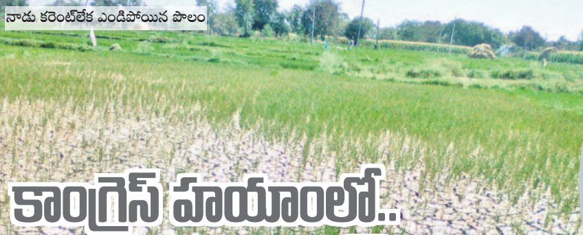
నాడు కరెంట్ లోక ఎండిపోయిన పొలం