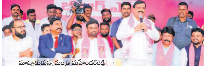
మాట్లాడుతున్న మంత్రి మహేందర్ రెడ్డి