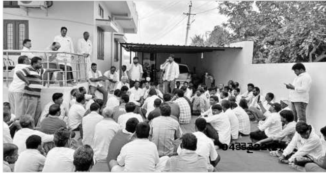
కల్యకుర్తి రూరల్: మార్కెట్లో పార్టీ నాయకులతో మాట్లాడుతున్న బీఆర్ఎస్ నాయకులు