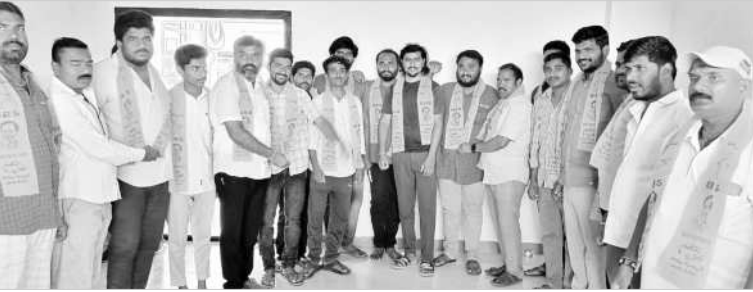
బీఆర్ఎస్ లో చేరుతున్న గుర్తుకుంట తండా యువకులు