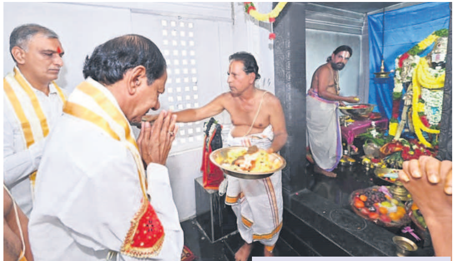
నంగునూరు మండలం కోనాయిపల్లి వేంకటేశ్వర స్వామి ఆలయంలో ప్రత్యేక పూజలు చేస్తున్న సీఎం కేసీఆర్, మంత్రి హరీశ్ రావు