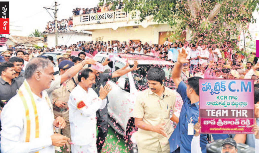
కోనాయిపల్లిలో ప్రజలకు అభివాదం చేస్తున్న సీఎం కేసీఆర్, మంత్రి హరీశ్ రావు

ముఖ్యమంత్రి రాకతో గ్రామంలో పండుగ వాతావరణం