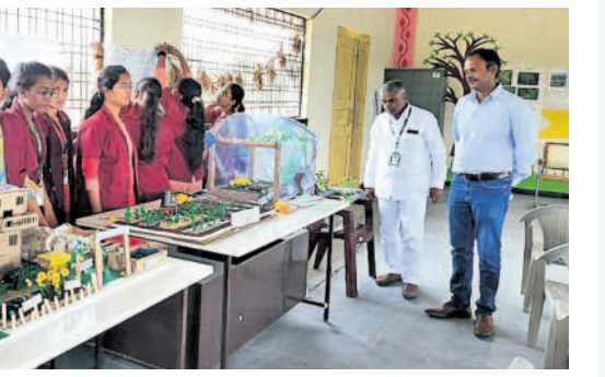
ఉద్యాన పంటలపై విద్యార్థులు చేసిన అవగాహన నడుస్తు